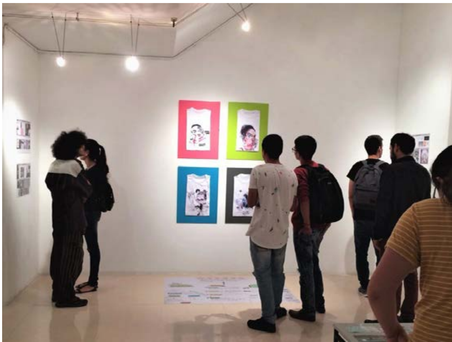
Figura 8. Exposición pública de la obra de creación

Algunos de los resultados visuales que se derivaron del ejercicio de co-creación, en los cuales diversas posturas, intereses, experiencias y lenguajes se integraron para representar las estéticas propias de los sujetos de estudio, fueron socializados a la comunidad de Pereira en el Colombo Americano de Pereira, mediante las “Exposiciones en corto”, un evento concertado con el Ministerio de Cultura, el Programa Nacional de Concertación Cultural en el Marco del Corto Circuito, Escenarios para el Arte a finales del año 2017 (Figura 8). La gran acogida del evento permitió una difusión amplia y dialogar con jóvenes que se veían reflejados en dichas composiciones visuales.