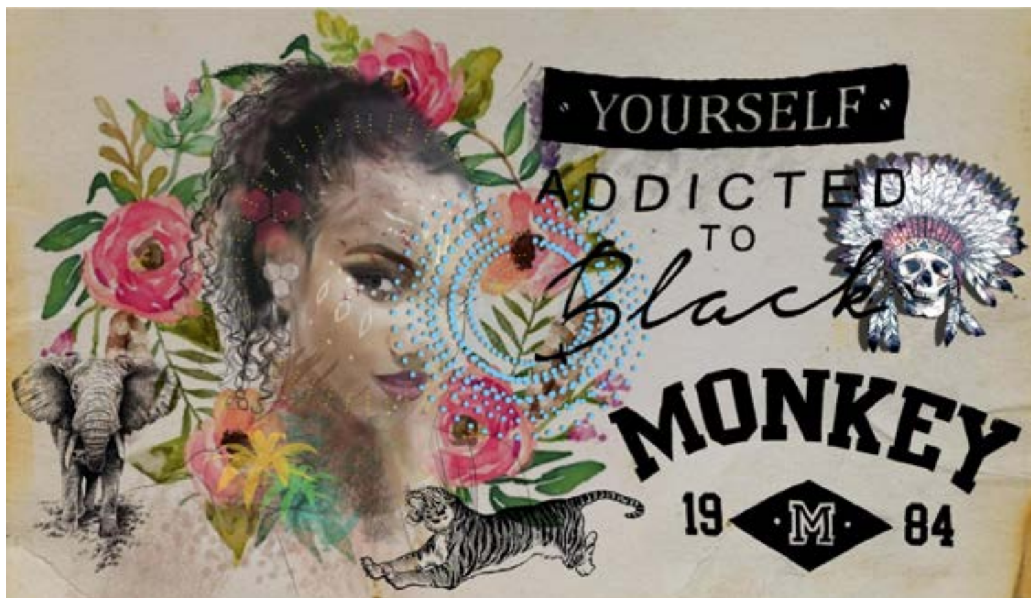
Figura 3. Composiciones visuales propuestas por medio de la co-creación.

Sanders y Stappers (2008) proponen el término co-creación para referirse a la creatividad colectiva resultante de un proceso compartido entre dos o más individuos creativos. Es en este escenario donde la práctica creativa propuesta tiene lugar como un ejercicio que propende por la multiplicidad de perspectivas, la variedad argumentativa y los aportes individuales a la construcción del imaginario colectivo. Las técnicas usadas vincularon el dibujo análogo con los medios de expresión digital en una fusión cromática que guardaba estrecha relación con las intencionalidades comunicacionales y la influencia del lenguaje gráfico en los jóvenes participantes. A continuación, se recopilan algunos de los resultados derivados de la práctica colaborativa de creación visual, desde referentes, gráficos, perceptivos y con intencionalidades comunicativas que exteriorizan los intereses del grupo que representan ( Figura 3, Figura 4, Figura 5, Figura 6 y Figura 7 ).