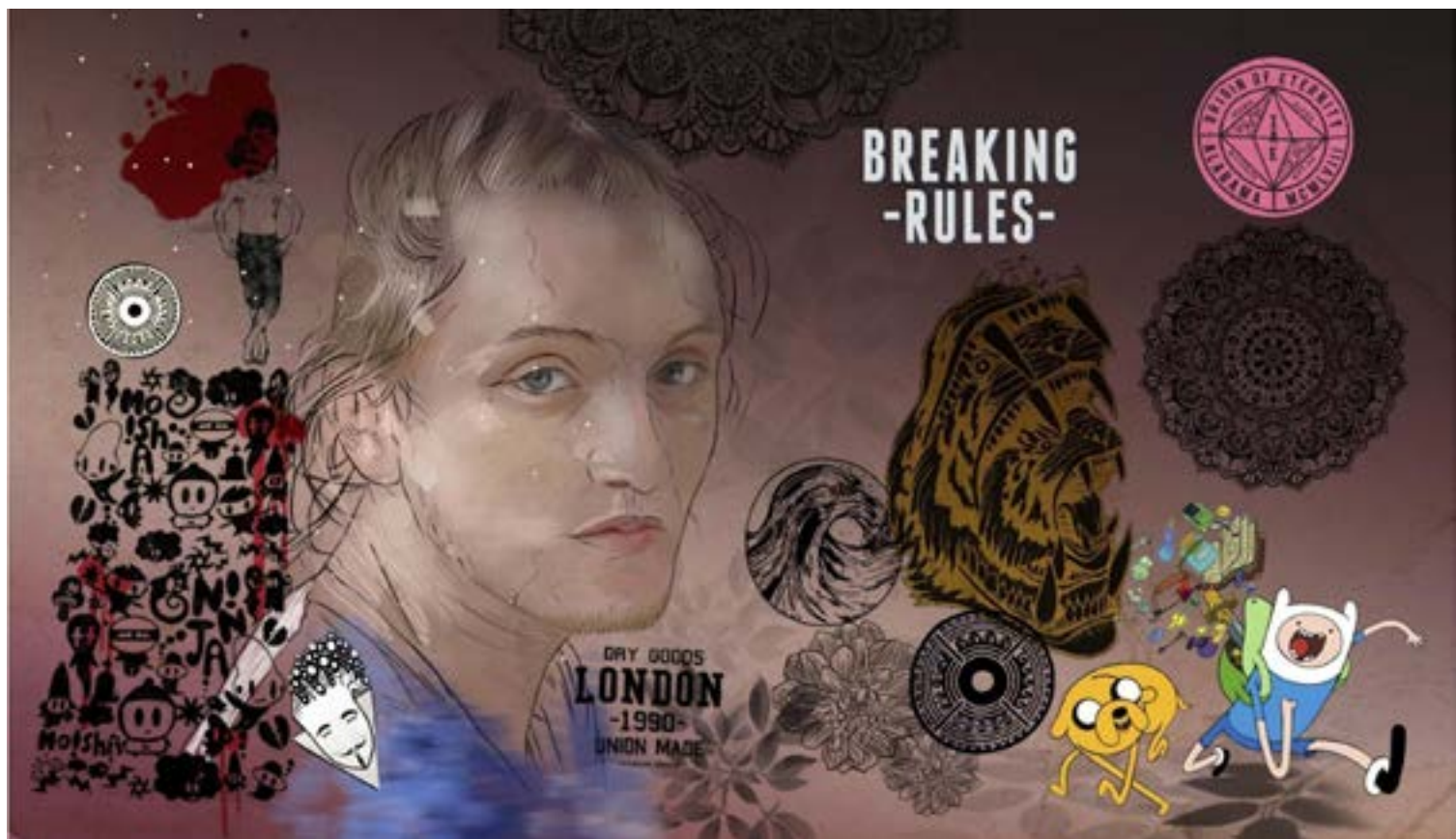
Figura 6. Composiciones visuales propuestas por medio de la co-creación.