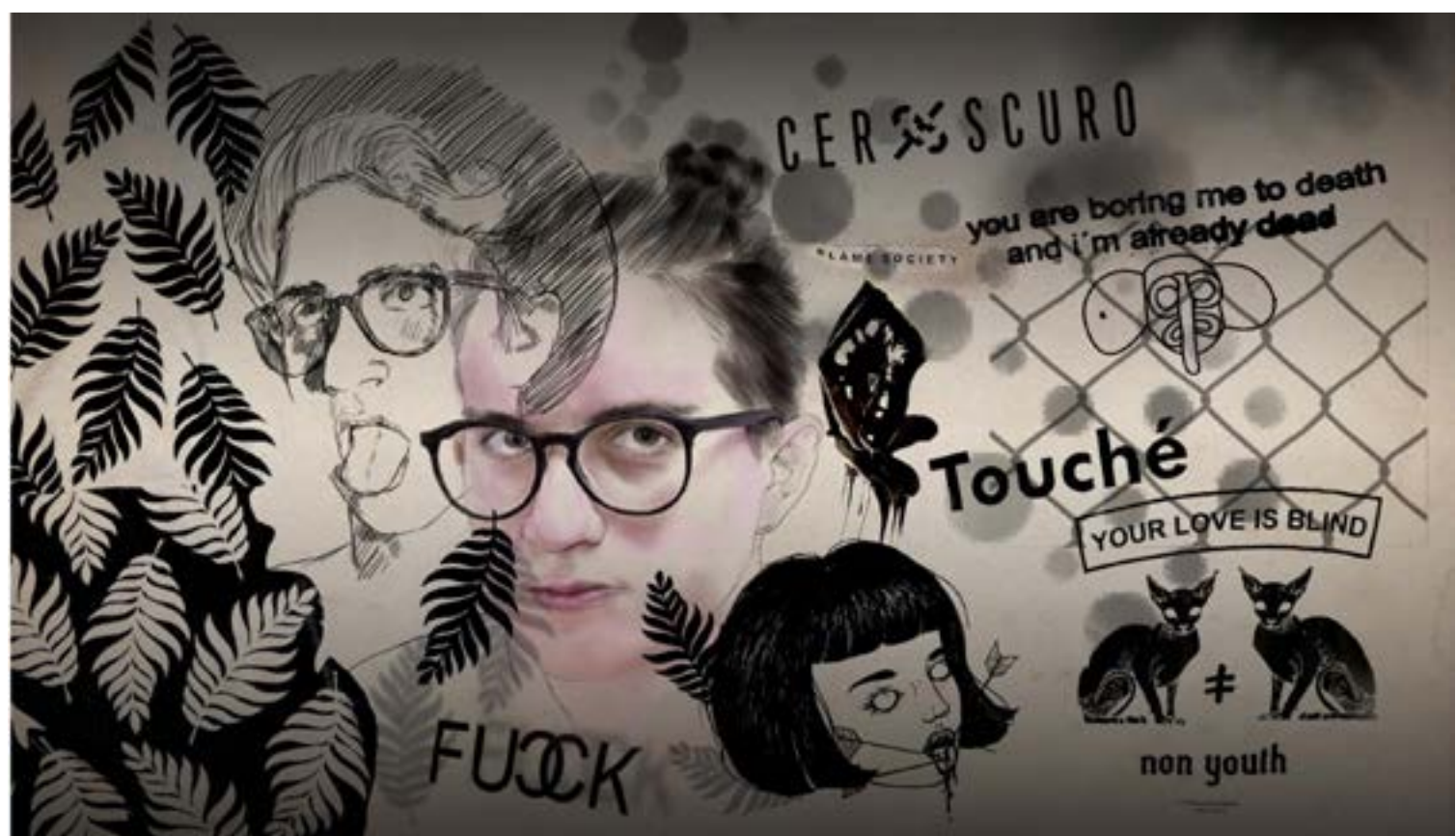
Figura 5. Composiciones visuales propuestas por medio de la co-creación.