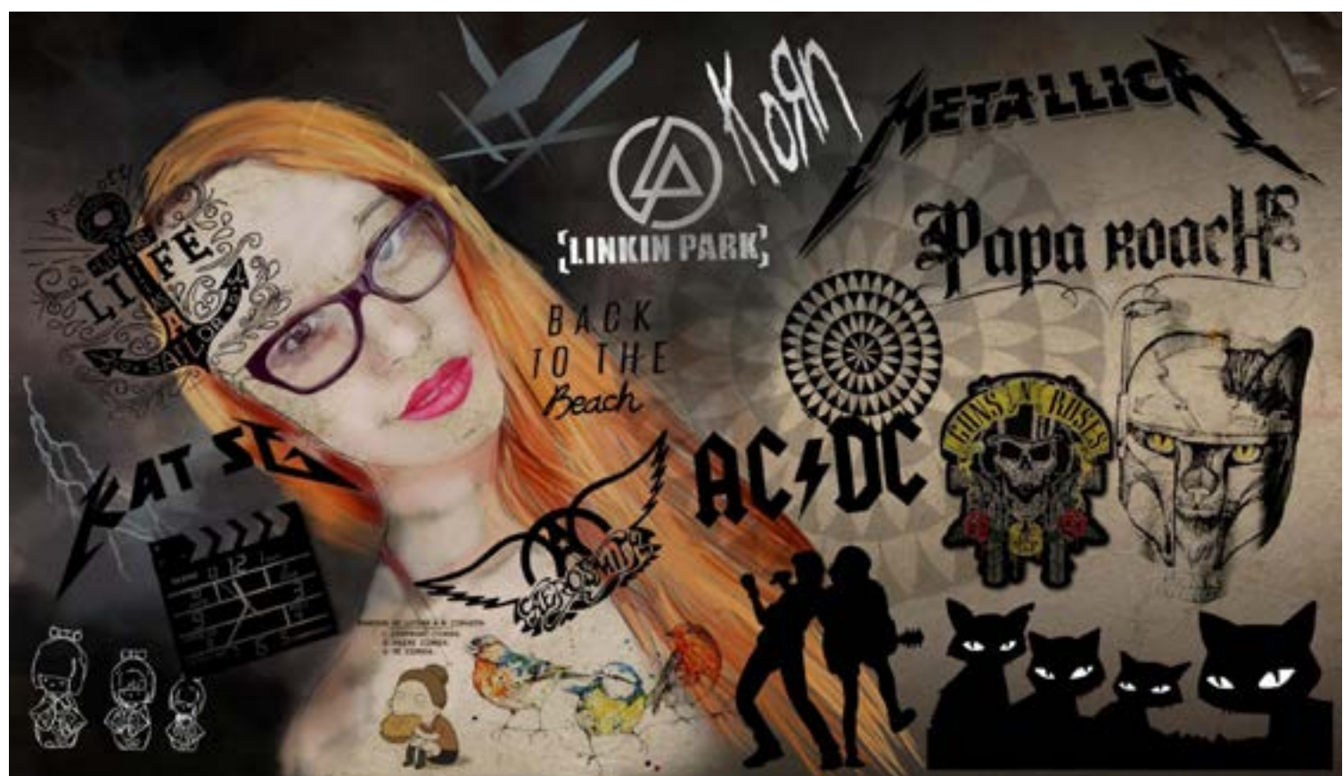
Figura 7. Composiciones visuales propuestas por medio de la co-creación.