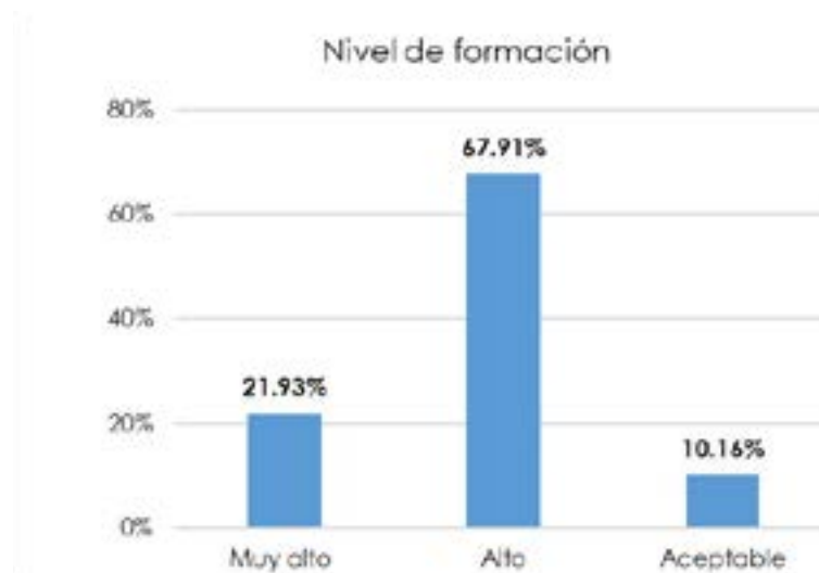
Figura 2. Nivel de formación de los egresados de la Universidad de Boyacá según opinión de empleadores.