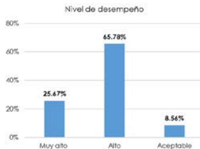
Figura 3. Nivel desempeño de egresados UdB según opinión empleadores.

La Figura 3 , evidencia la satisfacción que tiene el empleador con respecto al desempeño laboral del egresado, el 65,78 [IC 95% 59-72] lo evalúan en un nivel alto, seguido de un 25,67% [IC 95% 19-32] quienes consideran un nivel muy alto; finalmente, el 8,56% [IC 95% 4-11] considera que el desempeño laboral de los profesionales es aceptable; lo que significa en los egresados concordancia entre las competencias y los requerimientos exigidos por las empresas contratantes.