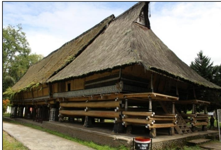
Gambar 3. Bangunan utama Rumah Bolon

Rumah Bolon berukuran panjang 29,44 meter, lebar 7 meter dan tingginya 5 meter, mempunyai 20 tiang penyangga dari kayu besar yang berornamen Simalungun, sedangkan lopou mempunyai 10 buah galang terbuat dari kayu besar. Bagian belakang Rumah Bolon , dilengkapi dengan tungku masak ( tataring ) dan tikar alas tidur masing-masing istri raja, yakni lima terletak di sisi kiri dan lima lainnya di sisi kanan. Jadi mereka tinggal secara bersama-sama dalam Rumah Bolon , tetapi mereka memasak keperluan makanannya sendiri-sendiri. Anak-anak mereka diperkenankan tinggal bersama di Rumah Bolon yang berbentuk los terbuka sampai umur 8-10 tahun (Regita, 2018).