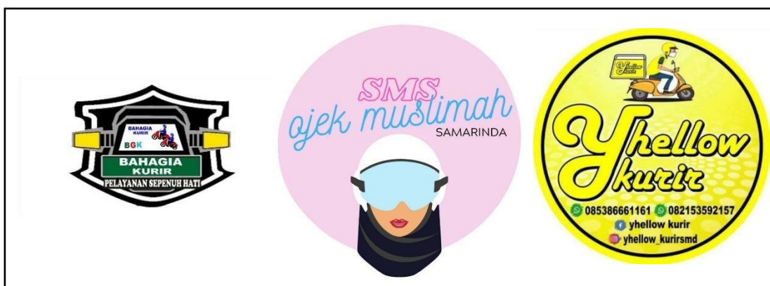
Gambar 1. Beberapa logo kurir lokal di Kota Samarinda

Kurir lokal merupakan model bisnis yang telah ada sejak tahun 2013 di Kota Samarinda. Kurir lokal di Kota Samarinda melayani pengiriman barang baik berupa kuliner ataupun non kuliner. Munculnya bisnis jasa kurir tidak lepas dari kebutuhan produsen dan konsumen dalam pendistribusian barang di Kota Samarinda. Dari penelitian yang telah dilakukan didapatkan data sebagai berikut,