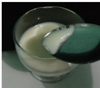
Gambar 2. Tekstur soyghurt

Tekstur soyghurt pada ketiga waktu inkubasi dan konsentrasi gula tidak menunjukkan perubahan tekstur (Tabel 2). Hal ini diduga bahwa waktu inkubasi yang dilakukan memiliki rentang yang terlalu singkat, sehingga perubahan yang terjadi tidak terlalu signifikan. Tekstur soyghurt pada umur simpan 1 hari belum mengalami perubahan. Tekstur soyghurt mengalami perubahan pada hari kedua penyimpanan, yaitu terdapat cairan bening di atas lapisan soyghurt dan terlihat lebih encer (Gambar 2).