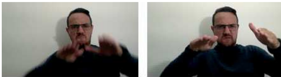
MESA – Sinal icônico