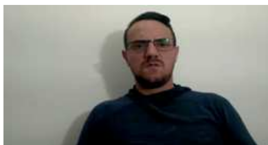
Figura V: Quadros de imagens do intérprete/tradutor em Libras