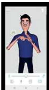
Figura IV: Quadros de imagens da tradução do aplicativo VLibras

Seguem, agora, os quadros e imagens produzidos no aplicativo VLibras , em Figura IV, para a frase: (a) Bato na mesa violentamente (p. 27):