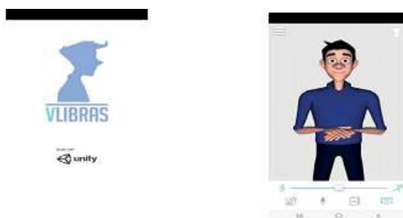
Figura II: Aplicativo VLibras