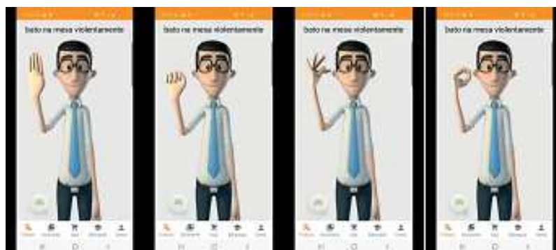
Figura III: Quadro de imagens da tradução do aplicativo Hand Talk