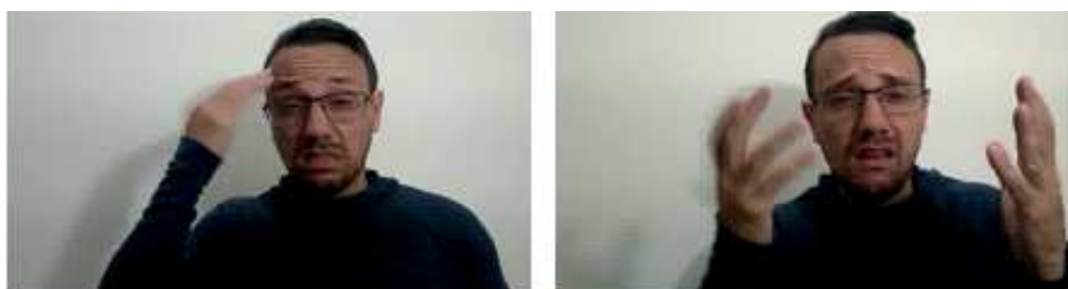
Figura VI: Quadros de imagens do intérprete/ tradutor em Libras

Vejamos as imagens do intérprete/tradutor de Libras para verificarmos como o mesmo realizou a tradução dessa frase em Figura VI: