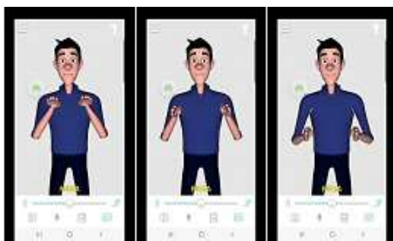
MESA - Sinal icônico