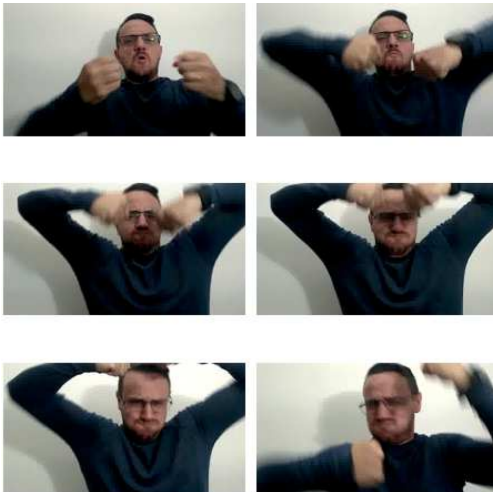
BATER – Verbo direcional