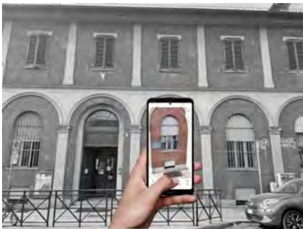
Figura 2 Esempio di rilievo speditivo di un fronte mediante utilizzo di distanziometro laser e app collegata.