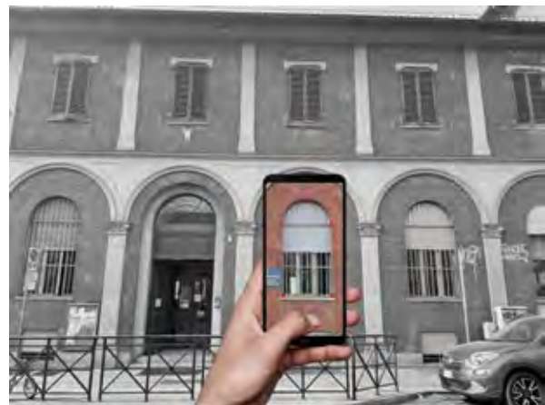
Figura 3 Esempio di rilievo speditivo di un fronte mediante app.