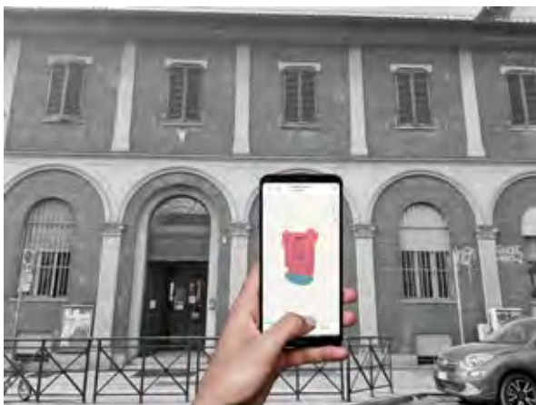
Figura 4 Esempio di rilievo speditivo di un fronte mediante fotocamera LiDAR e app.