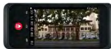
Figura 1 Alcuni strumenti utilizzabili per il rilievo speditivo dei fronti.