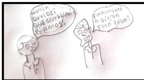
Figura 3. Exemplo de Desfecho do Grupo 3.

conseguiram traduzir todos os fatos, em algumas passagens da narrativa se utilizaram bastante da linguagem verbal.