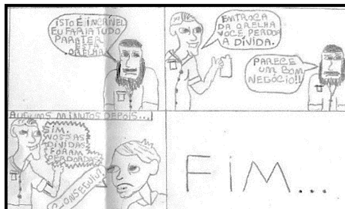
Figura 2- Exemplo de Desfecho do Grupo 2.