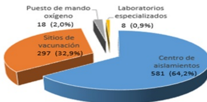
Gráfico 1. Integración de estudiantes a otras tareas de enfrentamiento de la Covid -19.

Del universo general previsto, 904 estudiantes se integraron también a otras tareas de enfrentamiento de la Covid-19. El 64,2% equivalente a 581 estudiantes de todas las carreras trabajó de manera voluntaria en más de ocho centros de aislamiento habilitados en el territorio, incluyendo en la propia Facultad de Ciencias Médicas que tuvo un centro activo durante siete meses con pacientes confirmados y sospechosos de la enfermedad. Un 32,9% desarrolló acciones en sitios de vacunación, mientras que el 2% apoyó las acciones de coordinación y seguimiento en puestos de mando de oxígeno. Otro grupo de estudiantes pertenecientes a la carrera de Bioanálisis Clínico apoyaron turnos de trabajo en Laboratorios especializados en el diagnóstico de la enfermedad, mediante la educación en el trabajo (Gráfico 1).