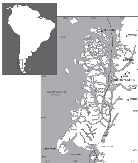
Figura 4. Possível roteiro do Padre José Garcia, em 1766, com base em seu diário.