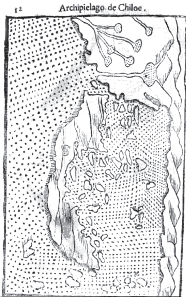
238 Figura 1. Mapa Archipelago de Chiloe, de Alonso de Ovalle, 1643.

outras áreas da América espanhola e portuguesa, os missionários da Companhia de Jesus realizaram uma autêntica conquista territorial, pari passu com suas atividades evangelizadoras. No caso chileno, como nos demais, suas expedições acabaram contribuindo para o reconhecimento inicial de regiões aonde os colonos e militares espanhóis chegariam, em alguns casos, apenas décadas após a passagem dos missionários jesuítas. Os mapas jesuíticos, ainda que escassos no caso do Chile, ainda são algumas das melhores fontes cartográficas para a região no tocante aos séculos XVII e XVIII. E, finalmente, as informações etnográficas levantadas sobre os grupos tehuelches, mapuches, poyas e chonos, entre outros, constituem importantes conjuntos de informações sobre os idiomas, costumes, espiritualidade e outras práticas sociais dos grupos indígenas do Chile colonial.