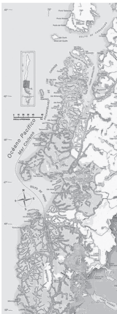
Figura 3. Arquipélagos meridionais chilenos – Chiloé, Chonos e Guaitecas.