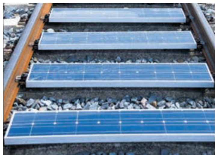
Solarzellen zwischen Eisenbahnschienen. Die Technik wird aktuell im Erzgebirge getestet.

Eine Bahnsprecherin zum WochenENDSpiegel: „Die DB hat im Erzgebirge ein Testfeld, um neue Technologien auf ihre Praxistauglichkeit zu testen. Die Bankset Energy Group erprobt derzeit auf dem DB-Testfeld bei der Erzgebirgsbahn Solarmodule auf Bahnschwellen. Auf dem Testfeld stellt die DB Unternehmen Gleise und Anlagen für die Erprobung innovativer Produkte zur Verfügung. Die Unternehmen, so auch die Bankset Energy Group, können dort unter realen Bedingungen Erfahrungen sammeln, ob ihre Technologien funktionieren und die gewünschten Effekte bringen. Die Tests finden zunächst unabhängig davon statt, ob die DB die Technologie selbst in ihrem Streckennetz nutzen wird. Innovationen auf dem Feld der alternativen Antriebe, Kraftstoffe und Infra-