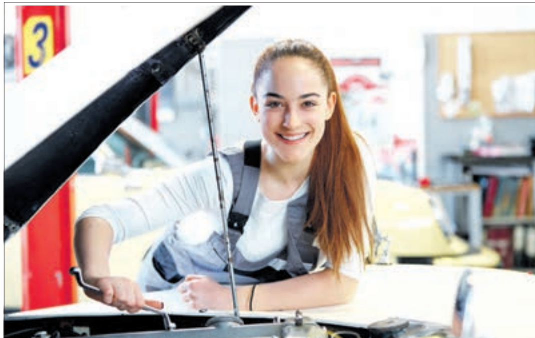
Trotz gestiegenem Interesse für Handwerksberufe: Fürs Ausbildungsjahr 2022/2023 sind sachsenweit noch zahlreiche attraktive Lehrstellen zu haben.

Region. In Sachsen ist das Interesse an einer dualen Berufsausbildung im Wirtschaftsbereich Handwerk unverändert groß. Bis Ende Juni 2022 kamen hier 2.785 Neu-Lehrverträge für das Ausbildungsjahr 2022/2023 zustande; das sind 188 (+ 7,2 Prozent) mehr als zum Vorjahreszeitpunkt. Damit setzt sich der seit vorigem Jahr wieder zu beobachtende Aufwärtstrend bei Neu-Lehrverträgen fort. Gegenüber 2021 deutlich mehr Zulauf fanden Offerten von Zahntechnikern, Augenoptikern, Dachdeckern, Bäckern und Fahrzeuglackierern. Gleichwohl: Die meisten Lehrverträge wurden bei Kfz-Mechatronikern, Elektronikern und Mechanikern für Sanitär-Heizung-Klima geschlossen. Trotz erneuten Zuwachses bei Ausbildungsverträgen im Handwerk sind im Freistaat weiterhin viele Hunderte Plätze noch unbesetzt. Besonders groß ist die Auswahl im Kfz-, im Elektro-, im Maurer-, im Metallbauer-, im Dachdecker- sowie im Sanitär-, Heizungs- und Klimatechnik-Handwerk. Sogar in mittlerweile eher rar gewordenen Handwerksberufen kann man mit Glück noch fündig werden: Bestatter, Brauer/Mälzer, Glaser, Graveur, Keramiker... – Alles in allem sind Ausbildungsplät-