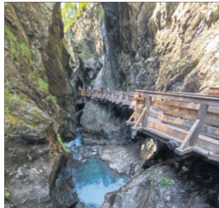
Die Kapruner Ache formte die steilen Felsen der Sigmund-Thun-Klamm. Sie zu durchwandern ist ein fantastisches Erlebnis, cool im wahrsten Sinne des Wortes.