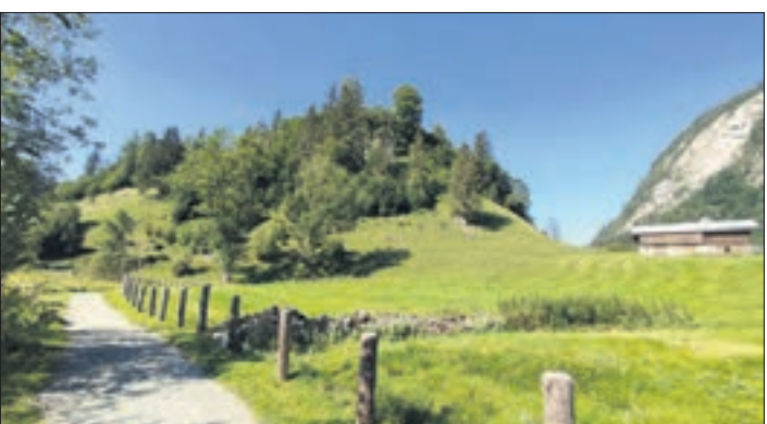
Mal gemütliche, mal anspruchsvolle Wanderwege erschließen das Land rings um Kaprun. Immer aber sind sie wunderschön!