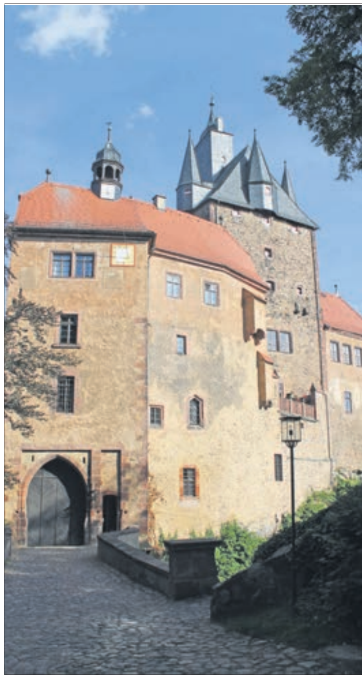
Die Burg Kriebstein lädt zur „Partynacht im Museum“ ein.

Die Burgmauern boten Schutz vor derartigen Gefahren, doch war das Leben hier auch nicht leicht. Die Besucher können den Waffenknecht durch eine der am besten erhaltenen Burgen Mitteleuropas begleiten. dzl