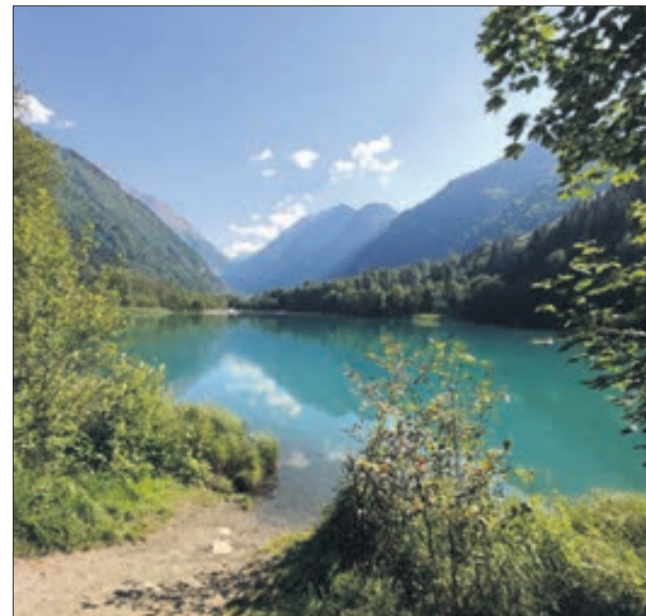
Zahlreiche klare, oft türkis schimmernde Bergseen sind nicht nur ein Genuss fürs Auge, sie verführen auch zum Baden.

Weitere Informationen finden Sie unter www.kaprun.at oder www.zellamsee-kaprun.com