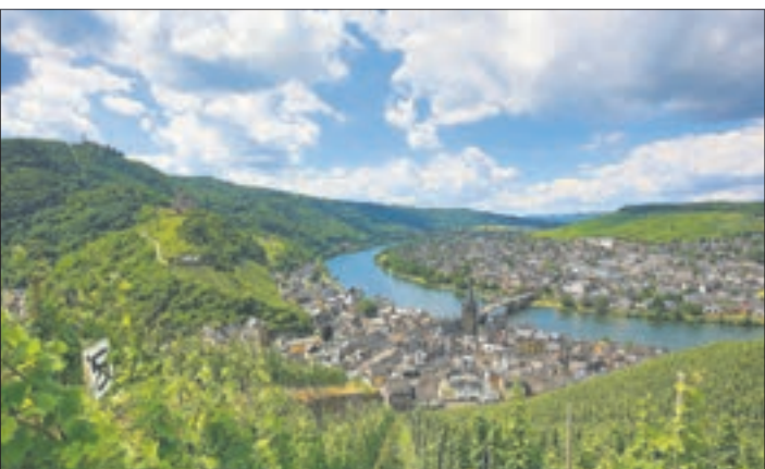
Das schmucke Bernkastel-Kues ist ein idealer Ausgangsort für Ausflüge ins Ferienland.