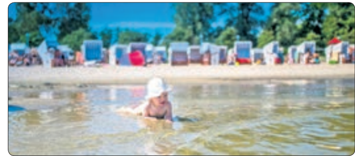
Am seichten Ufer des Stettiner Haffs können schon die Kleinsten baden.

flüge übers Haff nach Swinemünde oder Usedom. Ins grüne Hinterland führen dagegen Kanutouren, etwa auf dem naturnahen Flusslauf der Uecker. Wer mit dem Caravan, Zelt oder Wohnmobil anreist, kann auf einigen Stellplätzen direkt vor der Haustür schwimmen gehen. Die Broschüre „Die schönsten Campingplätze in der Uecker-Region“ steht unter www.urlaub-am-stettiner-haff.de zur Verfügung.