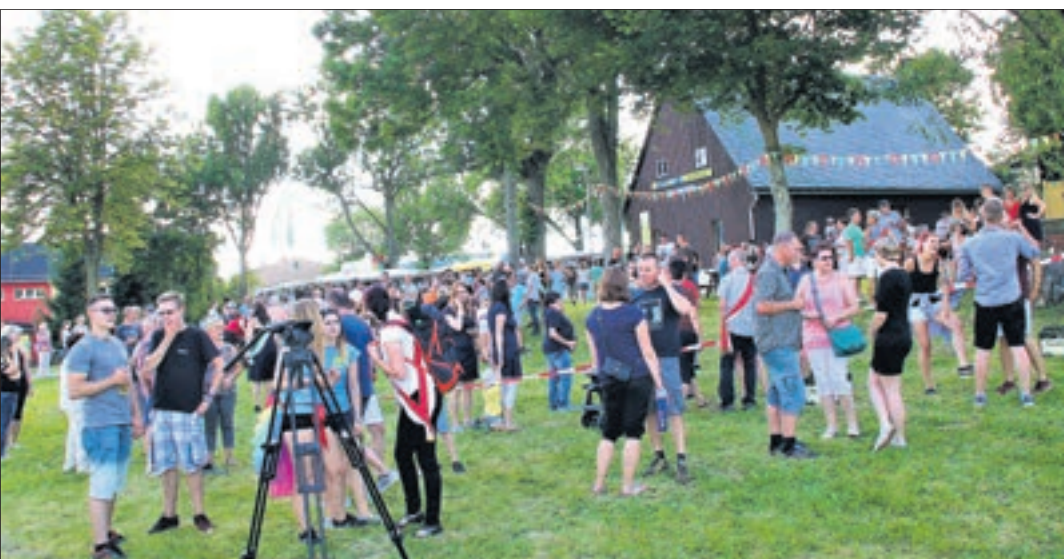
Großer Andran zum schützenfest auf der Festwiese 2017.