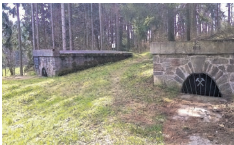
Unesco-Welterbe: Gleich zwei große Röschenmundlöcher der RWLA befinden im Unterdorf von Cämmerswalde, wo auch der Dorfbach den Kunstgraben kreuzt.

Cämmerswalde. Das Thema Welterbe Montanregion Erzgebirge/Krusnohori ist momentan in aller Munde: Die als Technisches Denkmal geschützte Revierwasserlaufanstalt Freiberg (RWLA) ist ebenfalls Teil dieser Unesco-Einstufung!