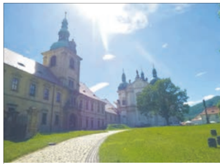
Das Zisterzienser-Kloster von Ossegg ist die „Wiege von Cämmerswalde“. Anno 1207 stand man nämlich in einer Zinsurkunde dieser sehr alten Anlage unter dem Motto „Arbeite und Bete“.