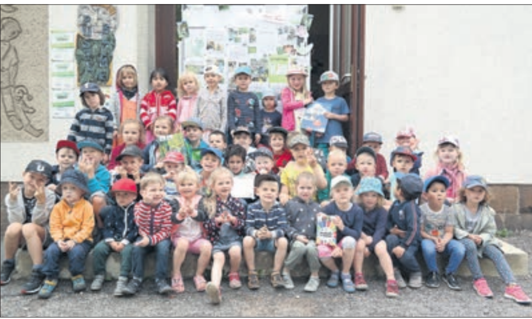
Die Freiberger Pustebblumen-Kinder können stolz auf ihr Projekt sein, dass beim Naju-Wettbewerb mit einem zweiten Platz belohnt wurde.

Freiberger „Pustebblumen-Kinder“ holen sich zweiten Platz beim Naju-Wettbewerb