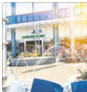
Zum Sonntagsummel ins Chemnitz Center.

Röhrsdorf. Die neue Herbstmode beim Sonntagsummel entdecken? Das Chemnitz Center öffnet am Sonntag den 10. Oktober von 12 bis 18 Uhr und lädt ein zum entspannten Einkauf an der frischen Luft mit 80 Fachgeschäften und 4.000 kostenfreien Parkplätzen! Unzählige Kollektionen der neuen Modeseason Herbst/Winter sind eingetroffen. Neben den zahlreichen namhaften, großen Stores wie C&A, Ernstings family, Lifestyle Xquisit, H&M oder TK Maxx gibt es viele beliebte kleine Boutiquen, darunter neu BLOB women, Camp david,