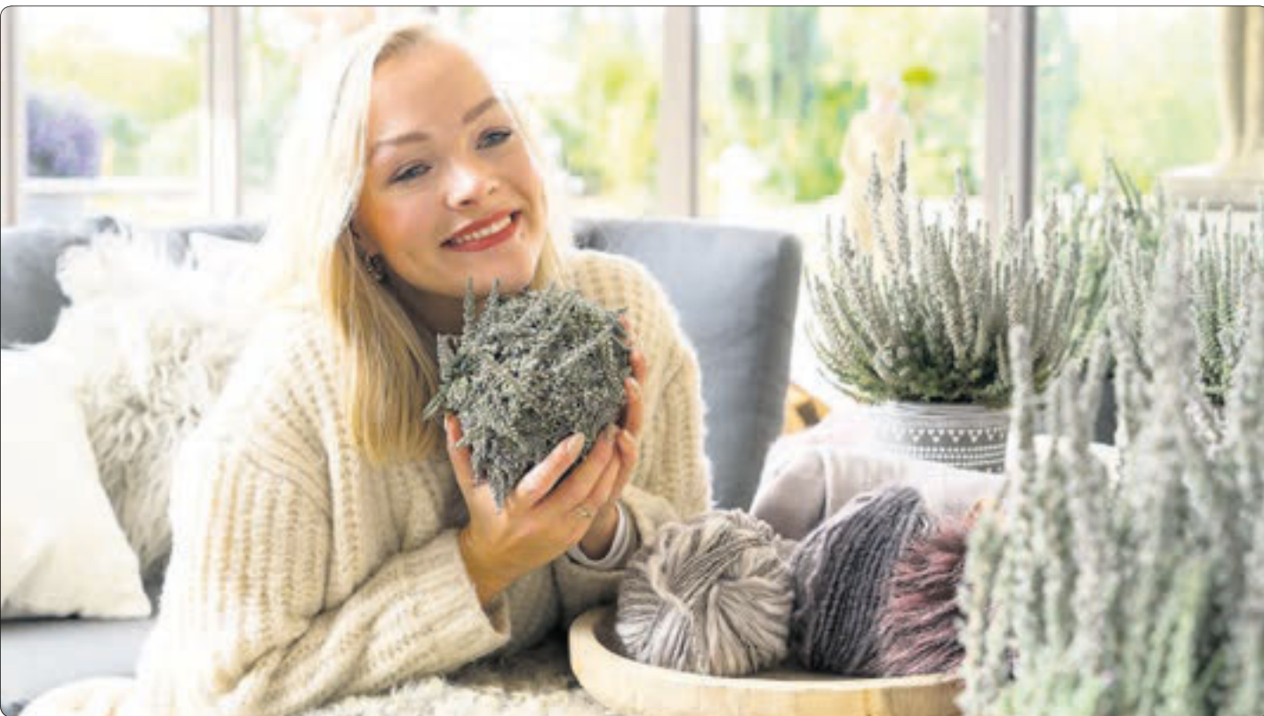
Für skandinavische Gemütlichkeit sorgt die Samtheide mit ihrem flauschigen Laub.

Kreativ und skandinavisch gemütlich dekorieren mit winterharten Pflanzen