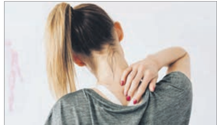
Sowohl Frauen als auch Männer plagen am meisten über Rückenschmerzen.

Wegen dieser Krankheit fehlten Beschäftigte in Chemnitz im Job