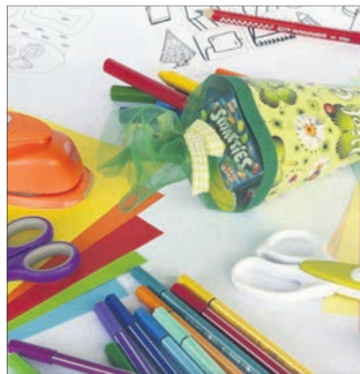
Auf den Schulanfang sollte man gut vorbereitet sein.

Auch Schreibhefte und -blöcke sind aus Recycling-Papier erhältlich. Bruchsicherer und umweltfreundlicher als ein Plastiklineal ist eines aus Holz, Spitzer aus Metall halten meist länger als ihre Kunststoff-Kollegen. Und beim Kauf von Radiergummi kann man welche aus Naturkautschuk wählen.