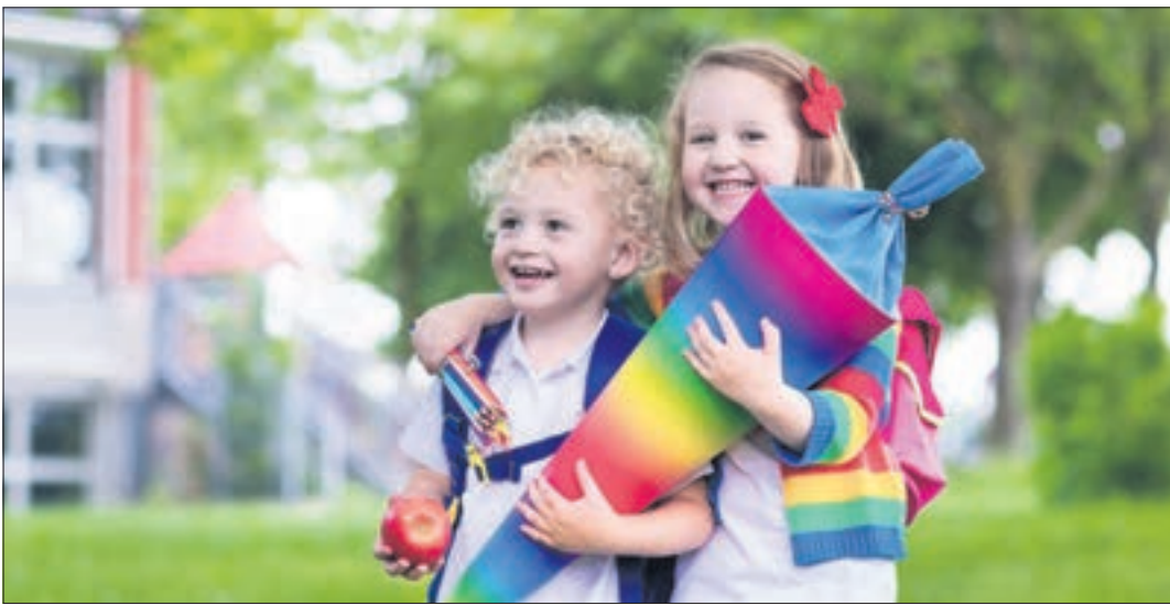
Mit dem ersten Schultag beginnt für die Kinder ein neuer Lebensabschnitt.