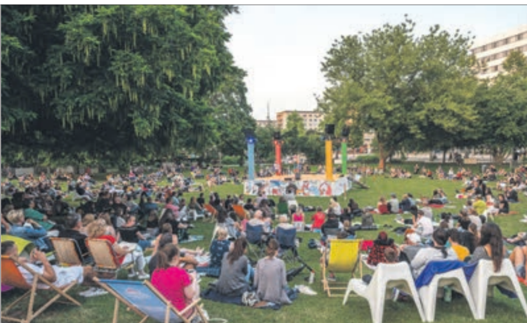
Poetry-Slam-Abend - eine der beliebtesten Veranstaltungen zum Parksommer 2022.

Chemnitzer Parksommer begeisterte mehr als 21.500 Besucher