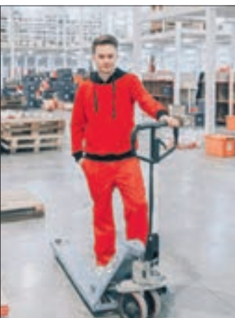
Der Mangel an Fachkräften hat in Deutschland einen neuen Höchststand erreicht.