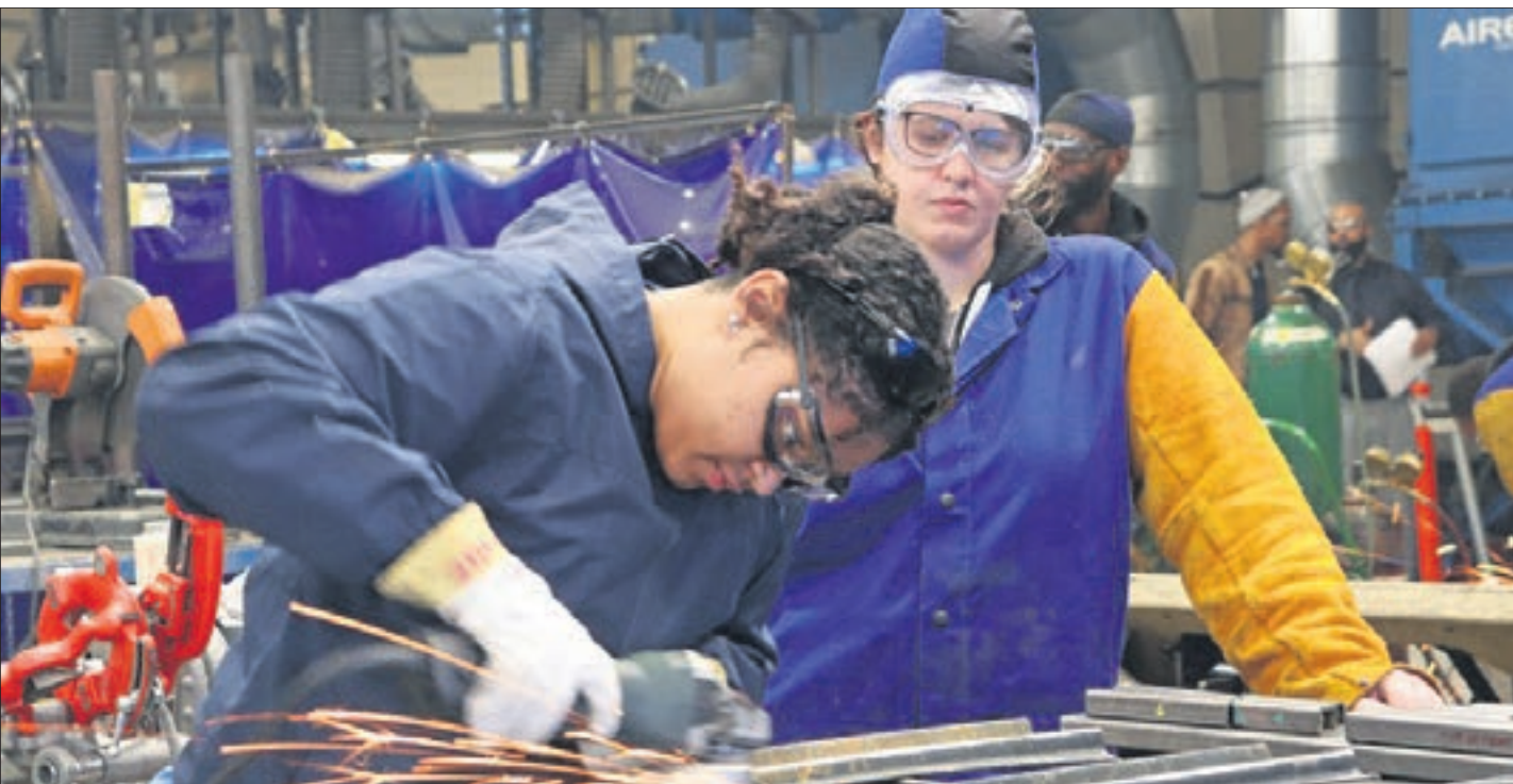
In vielen technischen und handwerklichen Berufen werden Fachkräfte händeringend gesucht. Das eröffnet vielfältige Chancen für einen Quereinstieg.