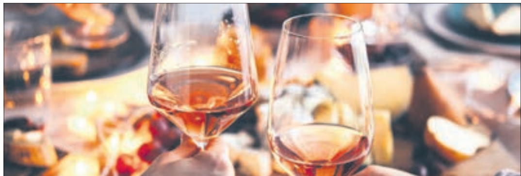
Auch wenn das Chemnitzer Weinfest vorbei ist - in und um Chemnitz herum gibt es zahlreiche Lokale und Biergärten, in denen das warme Wetter genossen werden kann.

Hier kennt man sich, hier schätzt man sich - und am Ende is(s)t man auch weniger allein. Gerade