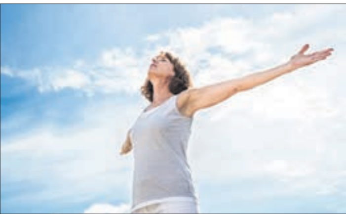
Wechseljahre und die Zeit danach: Für jede Frau ist es wichtig, sich in ihrem Körper immer wohlfühlen.

Die Wechseljahre sind eine Zeit der Umstellung, die jede Frau anders erlebt. Während einige kaum Veränderungen spüren, haben andere mit Begleiterscheinungen zu kämpfen. Stoffwechselexper-