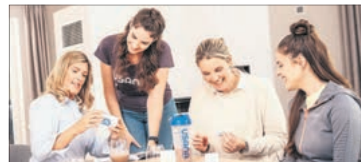
Laut Bundesverband Direktvertrieb haben sich knapp 1 Million Deutsche ein zweites Standbein im Direktvertrieb aufgebaut.

Vertriebspartner ist es, wenn sie sich für Ernährung, gesunden Lebensstil oder Sport interessiert. Das Unternehmen gibt jedem das Werkzeug an die Hand, um erfolgreich in den Nebenerwerb starten zu können. So erhält man zum Beispiel seinen eigenen, kostenfreien eCommerce Shop inklusive Lager, Logistik und Versand. Provisionen generiert man über Produktverkäufe. Informationen unter www.usana.com . djd-k