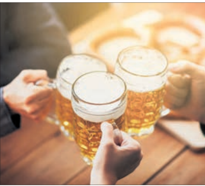
Ein kühles Bier genießen geht in den Chemnitzer Biergärten und Gaststätten mit Außenbereich am besten.