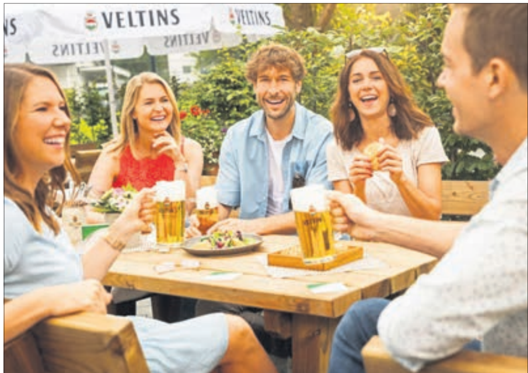
Endlich wieder eng zusammensitzen: In den Biergarten geht man zum gemütlichen Plausch mit Freunden, Bekannten oder Kollegen.

„Bis 2020 hatte die Zahl der Biergärten immer weiter zugenommen, in den 20 Jahren seit der Jahrtausendwende dürfte sie sich in etwa verdreifacht haben“, schätzt Ulrich Biene von der Brau-