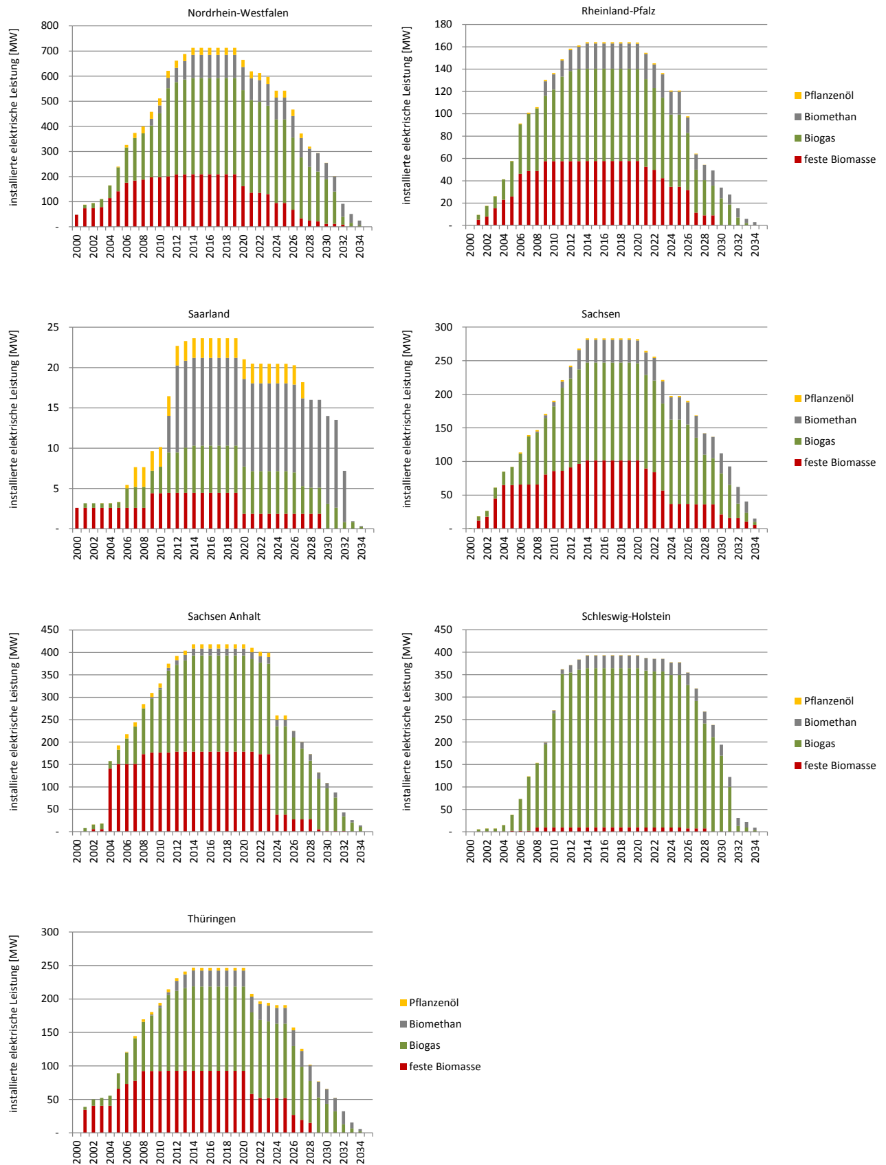
Abbildung 3-2: Voraussichtliche Entwicklung der installierten elektrischen Leistung des Anlagenbestandes bei Weiterführung des EEG 2014 und ohne Anschlussregelung für Bestandsanlagen auf Bundeslandebene für die Länder: Nordrhein-Westfalen, Rheinland-Pfalz, Saarland, Sachsen, Sachsen-Anhalt, Schleswig-Holstein und Thüringen