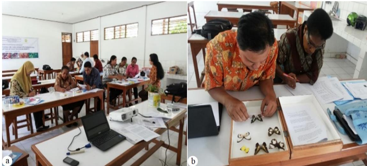
Gambar 2. Foto-foto kegiatan pelatihan. (a) penjelasan dan diskusi kelompok, (b) Peserta pelatihan sedang mengkarakterisasi beberapa spesimen kupu-kupu.

dalam menyerap materi tentang aplikasi materi keanekaragaman hayati dan dapat