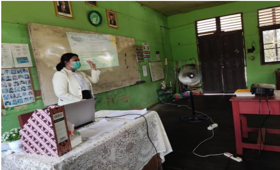
Gambar 4. Penulis memberikan materi layanan dengan metode ceramah