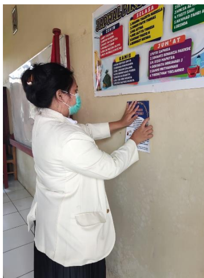
Gambar 1. Mempromosikan layanan BK di Sekolah

perilaku bullying terjadi dalam berbagai jenis; c) mengetahui aturan dan tata tertib yang berlaku di sekolah; d) Menyusun rencana tindakan pencegahan bullying ; e) menyediakan aturan kebijakan anti bullying ; f) menyediakan media pencegahan bullying bagi siswa dan guru; g) mendorong perilaku positif dalam relasi sosial siswa; h) menyelesaikan kejadian bullying secara bijak; i) menyediakan bantuan kepada siswa yang merupakan korban bullying ; dan j) menjalin kerja sama dengan pihak orang tua dan komite sekolah untuk penanganan bullying .