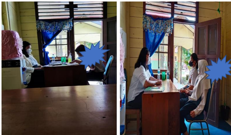
Gambar 5. Penulis memberikan sesi konsultasi kepada siswa

Hasil lembar penilaian segera (Laiseg) diketahui bahwa semua siswa mengisi dengan baik berdasarkan apa yang dirasakan. Beberapa aspek yang diungkap di dalam Laiseg misalnya: Siswa mengetahui topik layanan yang diberikan, mendapatkan pemahaman baru bahwa tidak baik melakukan bullying terhadap teman maupun orang lain dan setelah mengikuti layanan tersebut, siswa merasa senang dan menjadi paham mengenai perilaku bullying . Melalui lembar laiseg juga diketahui bahwa siswa menjadi paham bahwa terkadang perilaku yang sering dilakukan kepada teman termasuk tindakan bullying , oleh sebab itu siswa perlu berhati-hati di dalam melakukan aktivitas bercanda kepada teman. Siswa juga diajak untuk dapat memiliki komitmen secara pribadi, supaya di masa depan tidak mengulang kembali perilaku