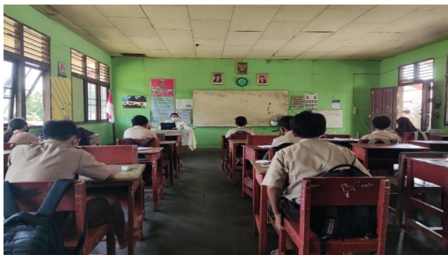
Gambar 3. Pemberian layanan pencegahan bullying pada kelas VII

Saat penulis melakukan program pencegahan bullying dengan psikoedukasi, hampir semua siswa mendengarkan dengan baik. Mereka sangat tertarik dan memperhatikan penjelasan yang sedang dipaparkan. Para siswa merasa dekat dengan hal tersebut, memiliki contoh nyata kekerasan dan atau bullying terjadi di dalam keseharian siswa. Sehingga dengan adanya layanan psikoedukasi, siswa dapat merefleksikan bahwa perilaku bullying dengan berbagai jenisnya harus dicegah. Di akhir sesi, para siswa juga mengisi lembar evaluasi dengan baik dan jelas, merasa materi yang disampaikan menambah pengetahuan, sesuai, dan menyenangkan. Psikoedukasi merupakan salah satu upaya yang bisa dilakukan untuk mengantisipasi terjadinya bullying di sekolah. Hal ini sesuai dengan penelitian sebelumnya, dimana dikemukakan bahwa ada beberapa cara yang dilakukan untuk mencegah dan mengatasi bullying , misalnya melakukan sosialisasi dan pelatihan untuk mencegah bullying yang diberikan kepada guru, orang tua dan siswa, mengadakan gerakan nyata pencegahan dan penanganan bullying yakni dengan menyusun aturan tentang tindak bullying di sekolah, mengadakan perayaan tentang hari sahabat, dan memasang kamera pengawas (CCTV) untuk tempat yang jauh dari pengawasan pihak guru (Saptandari & Adiyanti, 2013).