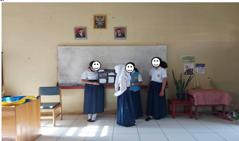
Gambar 6. Presentasi siswa tentang poster pencegahan bullying

bullying fisik, verbal atau psikologis yang mungkin pernah dilakukan siswa di sekolah.