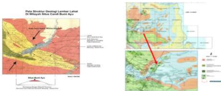
Gambar 2: Stratifigrafi Formasi Batuan Muaraenim di Kawasan Percandian Muarajambi

Terdiri dari batu pasir, batu lempung, batul anau dan batubara. Formasi Muara Enim berumur Miosen Akhir-Pliosen Awal, dan diendapkan secara selaras di atas Formasi Air Benakat pada lingkungan laut dangkal, dataran delta dan non-marine. Formasi Air Benakat (Tma) Formasi Air Benakat terdiri dari perulangan batu pasir dan batu lempung yang disisipi oleh batu lanau, dan ditandai pula dengan melimpahnya mineral glaukonit dan limonit serta kandungan fosil foraminifera besar.