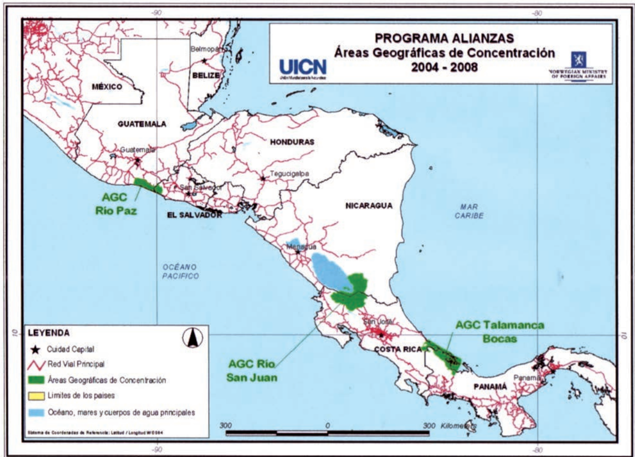
FIGURA 1. Áreas geográficas de concentración donde se ubican los consorcios.