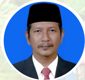
Walinagari Sei Batang Rustian, R