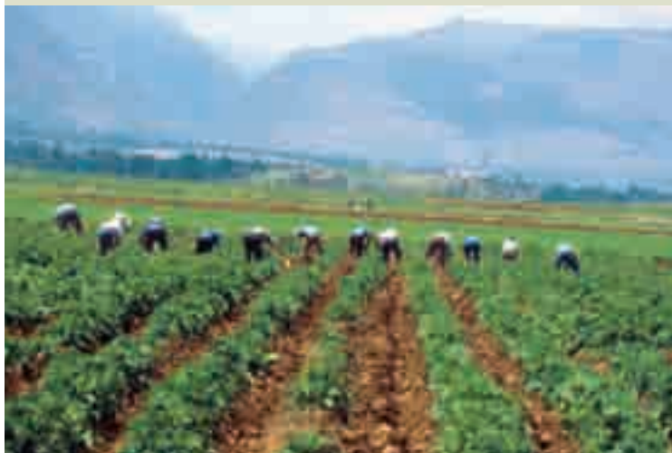
Ministerio de Agricultura

El hecho de que la compensación se dirigiera a cultivos específicos y no a todos los productores generó, antes de su implementación, que el área declarada como cultivada con estos productos se incrementara considerablemente. Aunque se anunció que el monto de compensación no se reduciría si el productor cambiaba su cédula de cultivos hacia cultivos más rentables, la poca confianza que el productor mexicano tenía en el Gobierno llevó a que muy pocos