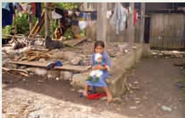
Niños del Milenio / GRADE

Como se mencionó, un efecto colateral no deseado de la mayor empleabilidad de la mujer en empleo asalariado es la potencial reducción de calidad en el cuidado de los niños (pequeños y grandes). Sin embargo, es posible mantener e incluso mejorar patrones educativos, nutricionales y de salud si se complementan las intervenciones de transferencias condicionadas con la profundización de los vínculos entre las guarderías y centros escolares de educación primaria y los centros de salud.