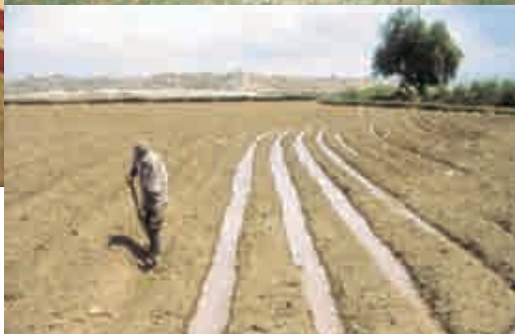
Ministerio de Agricultura