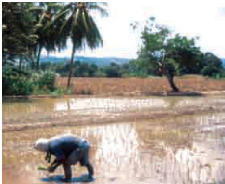
Ministerio de Agricultura

Para simular el impacto de la liberalización comercial del TLC se ha buscado modelar, en el marco de un modelo de equilibrio general, dos canales de transmisión: (i) un canal que conecta la política comercial y los precios domésticos, y (ii) un canal que conecta los precios domésticos y el bienestar de los hogares. Tal como lo muestra el gráfico adjunto, el primer canal (flechas azules) muestra el impacto directo de una liberalización comercial sobre los precios de productos “transables” (productos que se pueden exportar o importar) de una pequeña economía abierta como la peruana. Una vez que se reducen los aranceles, y la economía se enfrenta de manera más intensa a la competencia internacional, los precios domésticos tienden a alinearse con los precios internacionales. Estos cambios en los precios de productos transables pueden, a su vez, inducir a cambios en los precios de los productos no transables que se venden en el mercado nacional, así como cambios en los salarios y en los ingresos laborales de los trabajadores independientes. El segundo canal (flechas rojas) muestra cómo el cambio en precios domésticos (de productos transables y no transables) y salarios afecta el consumo e ingreso de los hogares.