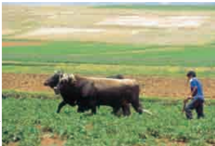
Ministerio de Agricultura

tivos pero otros no, dadas las restricciones locales que enfrentan. En este contexto es indispensable reconocer la inconveniencia de identificar cultivos perdedores y la dificultad de identificar individualmente hogares perdedores. Por ello, es conveniente optar identificar a los grupos vulnerables y su ubicación geográfica, diseñando políticas para enfrentar su vulnerabilidad, a fin de transferir a los hogares capacidades que les permitan adecuarse a las circunstancias cambiantes. Las experiencias de programas de apoyo desligados del cultivo (transferencias condicionadas a educación y salud) como los implementados en México o en Turquía muestran que es posible llegar a áreas vulnerables sin necesidad de condicionar a los hogares a ser productores de un cultivo o crianza considerado como vulnerable. Programas de este tipo, focalizados en las zonas de mayor vulnerabilidad, podrían asegurar que se compense a los hogares rurales afectados, aumente la liquidez en el sector rural (producto de las transferencias monetarias condicionadas que se podrían implementar) y se logren, al mismo tiempo, otros objetivos de largo plazo como el de elevar los niveles de educación, elemento crítico para mejorar la competitividad de largo plazo de la agricultura peruana, especialmente en las áreas de menor desarrollo relativo.