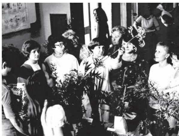
Фото 4 к С. 47 – Выставка лекарственного растительного сырья в аптеке №13 РУП «БЕЛФАРМАЦИЯ»