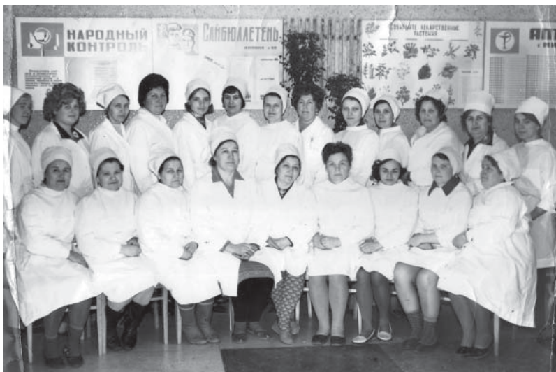
Фото 7 к С. 49 – Коллектив аптеки №58, г. Минск, 1977 г.