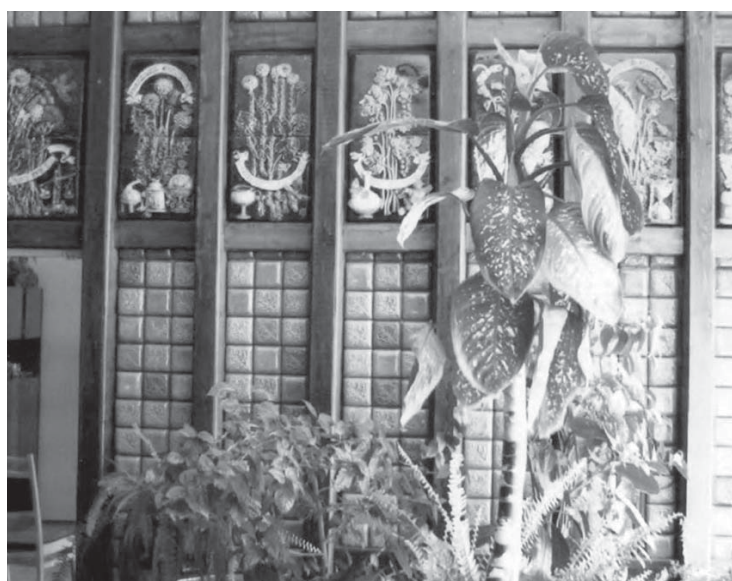
Фото 13 к С. 59 – Оформление торгового зала аптеки №137, г. Борисов, РУП «Минская Фармация»