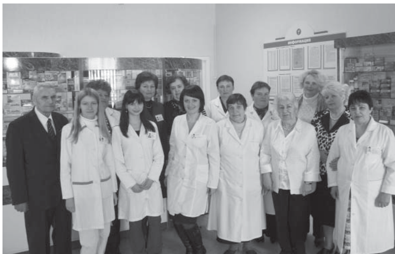
Фото 8 к С. 51 – Работники и ветераны аптеки №58, г. Минск, 19 апреля 2011 г.