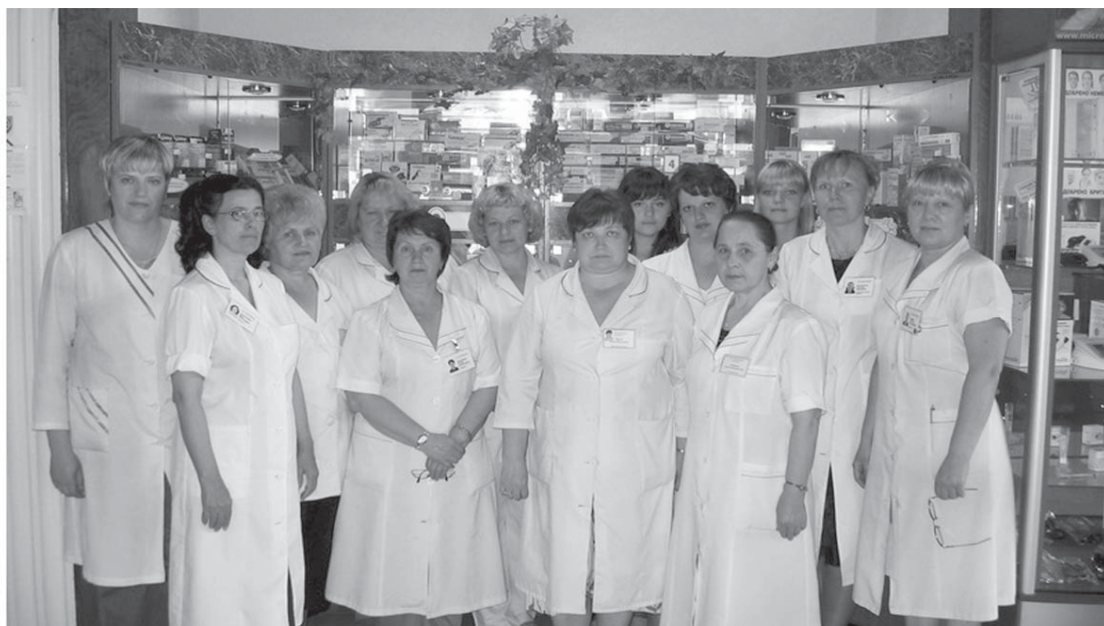
Фото 6 к С. 48 – Коллектив аптеки №13 РУП «БЕЛФАРМАЦИЯ» в наши дни