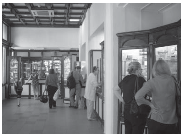
Фото 5 к С. 48 – В аптеке №13 РУП «БЕЛФАРМАЦИЯ» работает принцип «одного окна»