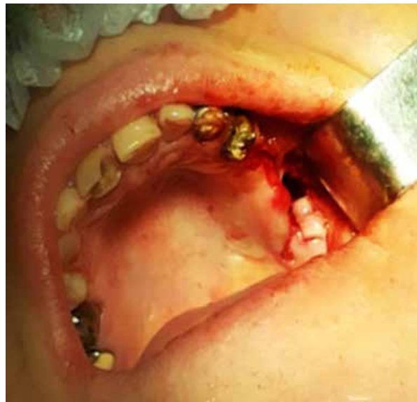
Рис. 3. Финистрационное отверстие в наружной кортикальной пластинке альвеолярного отростка верхней челюсти в проекции «причинного» зуба 2.6, имеющее сообщение с верхнечелюстной пазухой в области дна последней, полученное при удалении указанного зуба и цистэктомии

ного отростка в проекции верхушек корней «причинных» зубов.