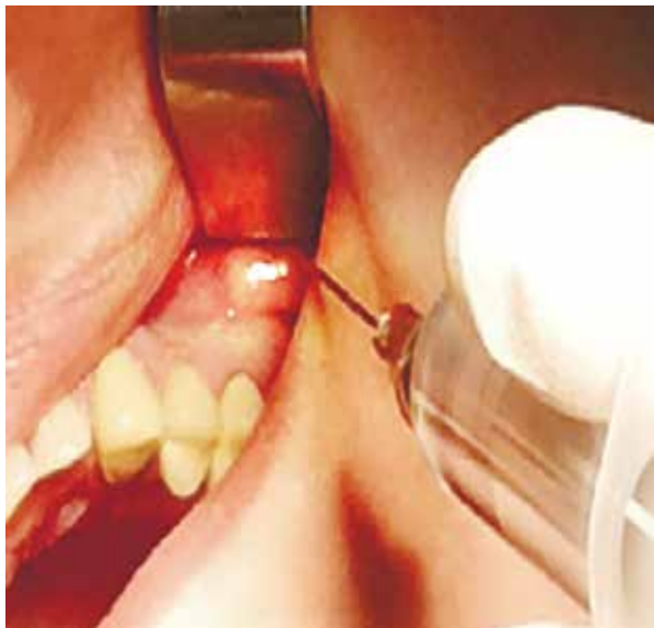
Рис. 2. Выполнение инфильтрационной анестезии с вестибулярной стороны в проекции корней «причинного» зуба