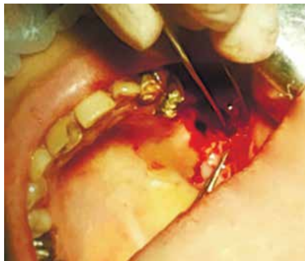
Рис. 4. Мобилизация слизисто-надкостничного лоскута с дезэпителизацией его краев

После операции назначался комплекс противовоспалительной терапии, включавший антибактериальные препараты в течение 5-7 суток с целью профилактики постлеоперационных воспалительных осложнений, десенсибилизирующую терапию в течение 10 дней, интраназально сосудосуживающие лекарственные средства в течение 2 суток с последующим