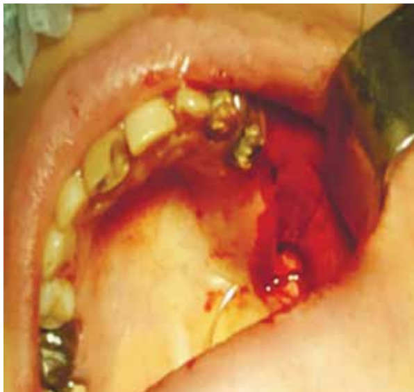
Рис. 5. Перемещение слизисто-надкостничного лоскута на область дефекта

переходом на препараты на масляной основе («Пиносол») для обеспечения нормального дренирования ВЧП. С целью обеспечения гемостаза и надежной профилактики кровотечения в послеоперационном периоде пациентам назначали «Дидинон». Непосредственно после вмешательства выполнялась 1 инъекция внутримышечно в объеме 2 мл антибактериального лекарственного средства («Линкомицин») с последующим переходом на таблетированную форму «Далацин» по 300 мг три раза в сутки в течение пяти дней.