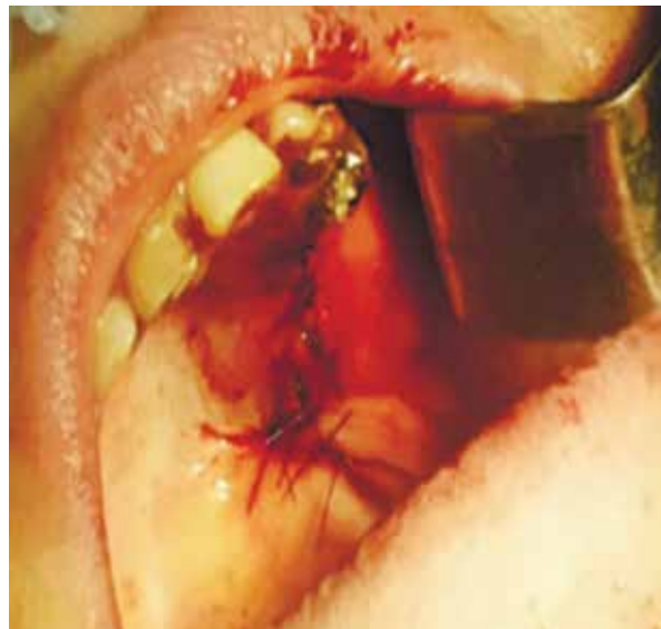
Рис. 6. Наложение отдельных узловых швов из полиамида 3/0 на операционную рану

Непосредственный результат оперативного вмешательства у всех наблюдаемых пациентов был положительный. Послеоперационная рана зажила первичным натяжением. Боли в области