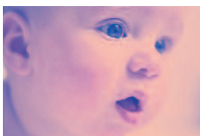
Cara de s_rpr_s_

OBSERVA LAS IMÁGENES Y COMPLETA LAS "CARAS" CON LAS VOCALES QUE FALTAN.