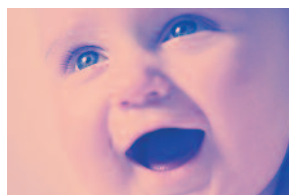
B_ _n_ cara