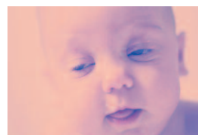
Cara de s_ _ñ_