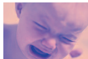
Cara de p_n_