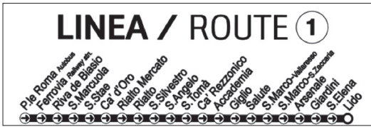
Figura 4 Línea 1. 2020 © Enric Bou