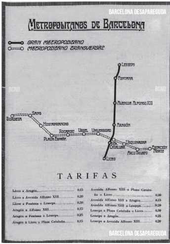
Figura 6 Mapa Metro Barcelona. 1925 © Enric Bou