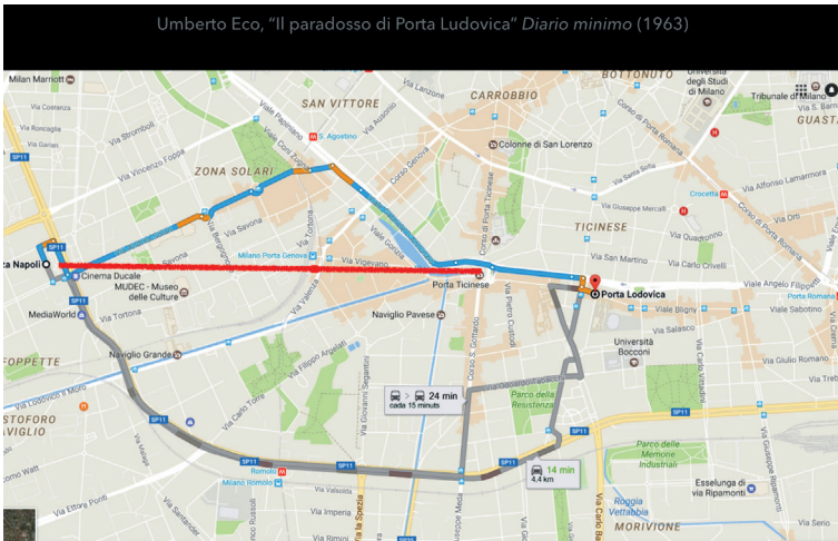
Figura 3 Plano Milán. 2017 © Enric Bou

discurso de 1945, identificó las dos montañas como el capitalismo y el feudalismo. La interpretación de Qiu Zhijie coincide de modo sorprendente con el proyecto chino de construir islas artificiales en el mar de China para así asegurarse el derecho al uso del mar y expandir su dominio territorial y marítimo en el mar de China. Es también un ejemplo patético de arte politizado y de manipulación de unas leyendas populares, proyectadas sobre el plano de una ciudad imaginaria, pero de sorprendentes semejanzas con Venecia.