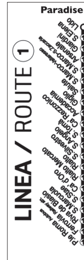
Figura 5 Línea 1 retocada. 2020 © Enric Bou

Fremden, die beste Gelegenheit, sich den Glauben zu verschaffen, richtig und rasch im ersten Anlauf in das Wesen von Paris eingedrungen zu sein. 2 (en Nervi 2011, s.p.)