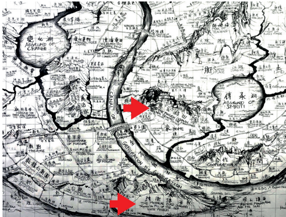
Figura 2 Qiu Zhijie Continuum – Generation by Generation (detalle). 2017