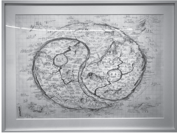
Figura 1 Qiu Zhijie Continuum – Generation by Generation. 2017 © Enric Bou