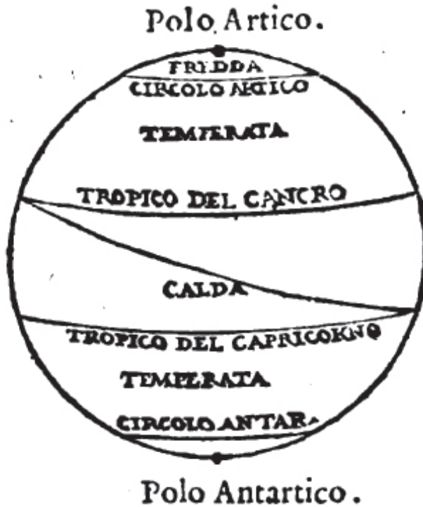
FIG. 2 - Schema di Alessandro Piccolomini.

rispetto alle regioni occidentali, che sarebbero perlopiù coperte dalle acque. Tuttavia «questo si è già conosciuto nei tempi nostri esser falso, per le moderne osservantissime navigationi». 50 Piccolomini introduce quindi nel quarto libro due aspetti importanti. Il testo di Aristotele non va interpretato nel senso che alcune zone sono disabitate perché inabitabili, ma semplicemente che sono difficilmente abitabili. Inoltre le osservazioni fatte attraverso le navigazioni provano indiscutibilmente la falsità di alcune opinioni di antiche autorità.