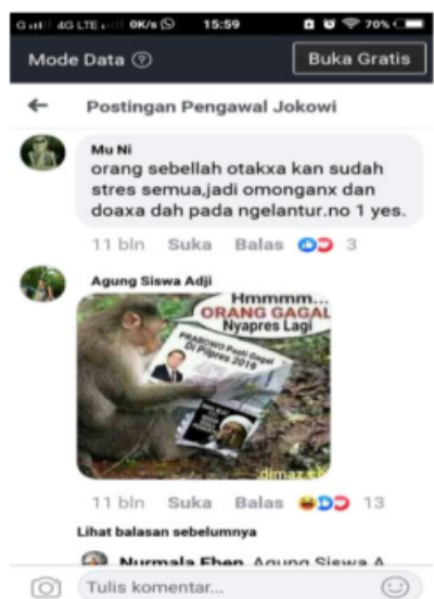
Gambar 5. Screenshoot Berita Hoax