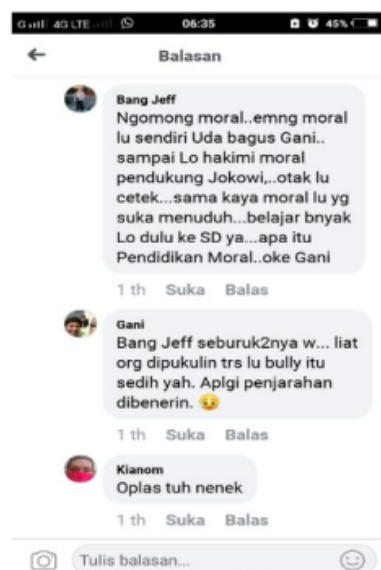
Gambar 7. Screenshoot Berita Hoax