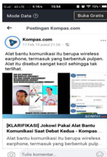
Gambar 2. Screenshot Berita Hoax