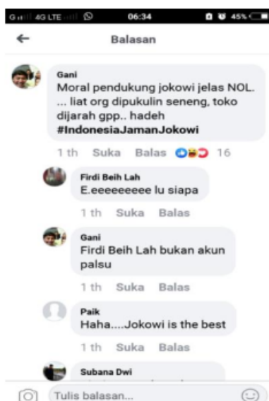
Gambar 6. Screenshoot Berita Hoax