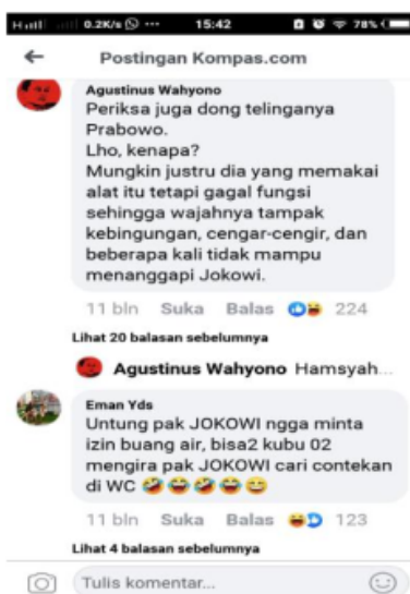
Gambar 3. Screenshot Berita Hoax