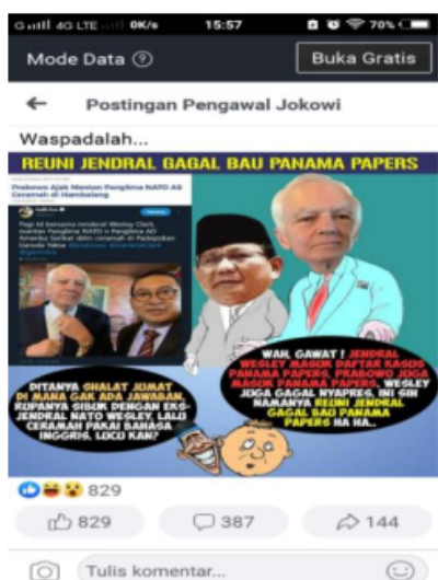
Gambar 4. Screenshoot Berita Hoax