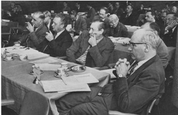
Figuur 2: landelijke Specialisten Vergadering 3 mei 1975.

Er werd in de jaren zeventig en tachtig van de vorige eeuw heel wat gepubliceerd over de schadelijkheid roken. Ook werd de beroepsgroep zelf meer aangesproken op het rookgedrag.