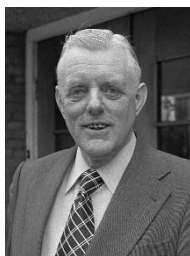
Figuur 4: Lenze Meinsma 1975.

Niet alleen wetenschappelijke onderzoek en publicaties in medische vakbladen speelden een rol in de langzaam veranderde inzichten en praktijken. Ook individuele acties van artsen en burgeractivisten waren van invloed. Deze activisten klommen op de barricades om aandacht te vragen voor het rokersprobleem. Zij vonden niet altijd (gelijk) gehoor, maar wisten vaak wel de publiciteit te halen en daarmee hielpen zij mee het roken op de publieke agenda te krijgen. aandacht te