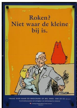
Figuur 7: Campagne Stivoro 1999-2006. Roken? Niet waar de kleine bij is.

Het doel van Stivoro was om campagnegewijs het (mee)roken tegen te gaan. De campagnes waren in te delen in verschillende groepen zo waren er campagnes die vooral