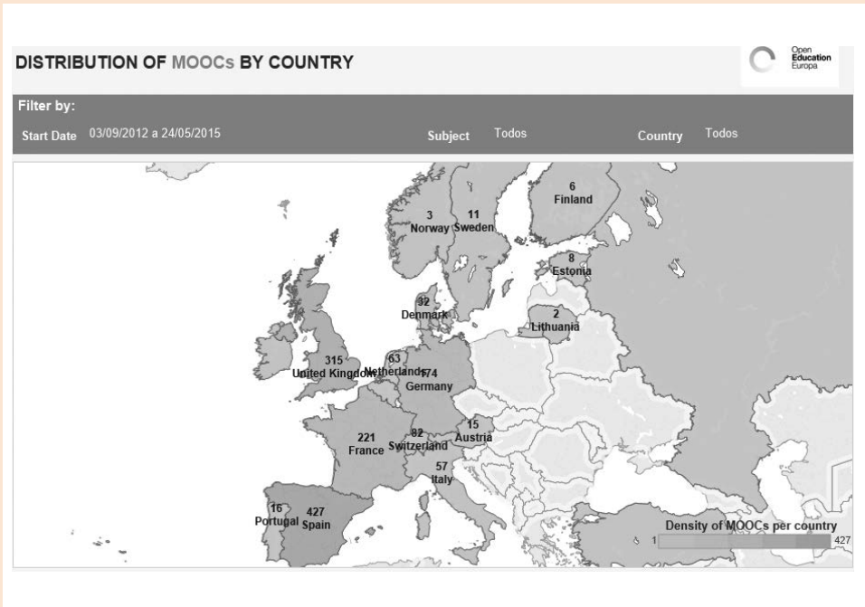
Figura 2. Número de MOOC por países en Europa (mayo 2015)