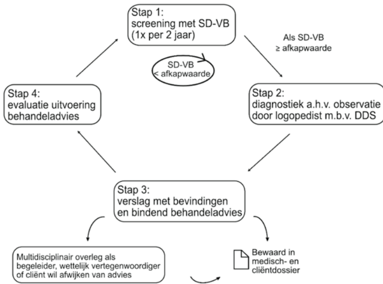
Figuur 2: Schematische weergave van het geoptimaliseerde cyclisch dysfagiewerkproces.

door eenduidige terminologie en concrete beschrijving. Bijvoorbeeld door aan te geven wanneer een maaltijd gemalen moet worden, en hoe grof of fijn dat mag zijn. Hiervoor worden binnen het huidige cyclisch dysfagiewerkproces de wereldwijd gebruikte International Dysphagia Diet Standardisation Initiative (IDDSI) levels gebruikt (Cichero et al., 2017). Alle logopedisten en diëtisten van Alliade zijn hierin geschoold. Zodra logopedisten een aanpassing in consistentie adviseren moeten diëtisten betrokken worden om dieetadviezen te geven en te bewaken dat cliënten een goede voedingstoestand behouden of bereiken. Logopedisten en diëtisten van Alliade hebben een IDDSI-waaiër ontwikkeld waarin per consistentielevel beschreven staat wat hierbinnen valt. Bijvoorbeeld: bij IDDSI-level 6 mag een boterham aangeboden worden zonder korst in kleine stukjes van maximaal 1,5 bij 1,5 cm. Ook kunnen zorgverleners met behulp van de informatie op de waaiër testen of ze het eten of drinken in de juiste consistentie hebben klaargemaakt. De multidisciplinaire samenwerking met de diëtisten is bevorderd door het cyclisch dysfagiewerkproces.