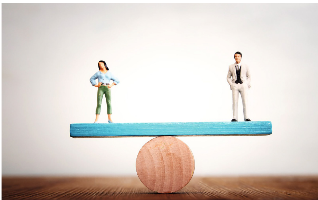
Vrouwen krijgen minder vaak een ziektediagnose voor lichamelijke klachten dan mannen.

einddiagnoses worden onderscheiden naar ziektediagnoses (ICPC \geq 70) en symptoomdiagnoses (ICPC < 30). In ons onderzoek includeerden we alle klachten uit de subschaal Somatisatie van de Symptom CheckList-90. Deze klachten zijn veelvoorkomend en blijven vaak onverklaard. 10,12