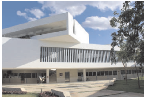
Figura 1 Fachada de la Facultad de Educación Unidad Mérida

Actualmente, esta facultad ofrece programas educativos en la Unidad Mérida (Ver figura 1) como parte del Campus de Ciencias Sociales, Económico-Administrativas y Humanidades (CCSEAH) y en la Unidad Multidisciplinaria Tizimín (Ver figura 2). Ofrece dos programas educativos de licenciatura (Licenciatura en Educación y Licenciatura en Enseñanza del Idioma Inglés) y tres programas educativos de posgrado (Especialización en Docencia, Maestría en Investigación Educativa y Maestría en Innovación Educativa).