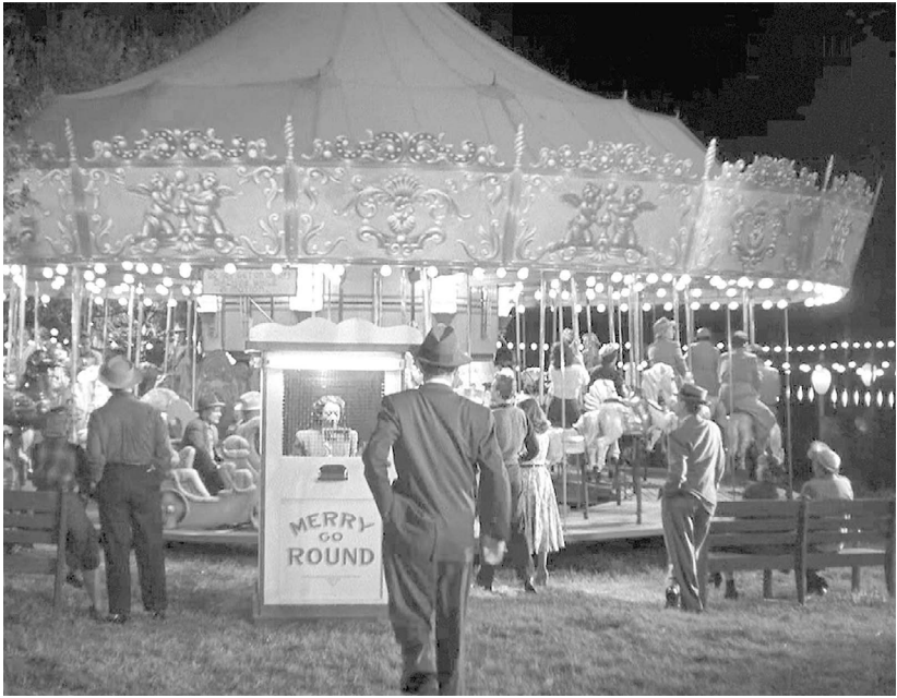
Szenenfoto aus: Alfred Hitchcock: DER FREMDE IM ZUG (1951)