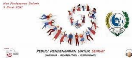
Gambar 4. Spanduk Yang Digunakan Dalam Kampanye Pendengaran Untuk Semua

Beberapa poster yang dibuat dimaksudkan untuk menumbuhkan kepedulian terhadap fungsi pendengaran antara lain adalah (1) poster yang menyajikan fakta 360 juta orang menderita gangguan pendengaran, (2) poster yang menunjukkan pemerintah Indonesia dalam keseriusannya mencegah ketulian yang diakibatkan kebisingan, (3) poster yang berisi bahwa beberapa fakta yang menyebabkan gangguan pendengaran diantaranya adalah penggunaan headset, (4) poster yang berisi untuk menjaga telinga supaya tetap sehat dan bersih