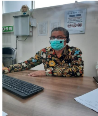
Gambar 10 Siaran Radio Rangka Kampanye Pendengaran Peduli Sesama