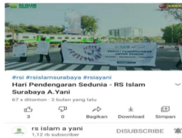
Gambar 7 Ajakan Kampanye Memperingati Hari Pendengaran Sedunia di Unggah Dalam Youtube Chanel