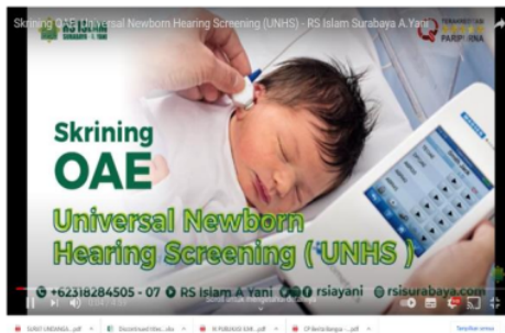
Gambar 6 Youtube Chanel Kampanye Pendengarann Peduli Sesama Bahwasanya Gangguan Pendengaran Bisa di Cegah Sejak Dini