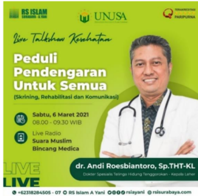
Gambar 9 Pengumuman Siaran Radio Peduli Pendengaran Untuk Semua di Media Sosial RS Islam Surabaya

Sosialisasi dilakukan di Radio Suara Muslim 93.8 merupakan radio yang memberikan siaran nasional dengan jumlah pendengar dewasa dan dari kalangan kelas-menengah perkotaan. Menyajikan ragam konten dan program yang mencerahkan, menyejukkan, dan menyatukan. Siaran radio yang dilaksanakan pada hari sabtu 6 Maret 2021 pada pukul 08.00 - 09.30. tujuan dari siaran radio ini adalah menyampaikan untuk pentingnya fungsi pendengaran dan peduli pendengaran untuk semua