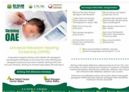
Gambar 3. leaflet Kampanye Memperingati Hari Pendengaran Sedunia Untuk Aksi Turun Ke Jalan

Poster, leaflet dan spanduk berisi himbuan agar masyarakat lebih peduli terhadap kesehatan telinga, terdapat 1 buah leaflet 4 poster dan 1 spanduk yang akan digunakan untuk aksi turun ke jalan .Leaflet yang berisi himbuan untuk mencegah gangguan pendengaran sejak dari usia bayi beberapa bayi yang memungkinkan untuk dilakukan untuk screening adalah (1) Bayi sehat tanpa factor resiko, (2) bayi dengan factor risiko.