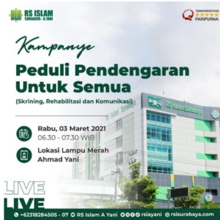
Gambar 1. Pengumuman Kampanye Peduli Pendengaran Untuk Semua di Media Sosial RS Islam Surabaya

pendengaran, macam - macam gangguan pendengaran. Bagaimana merawat telinga, jenis gangguan pendengaran pada telinga.