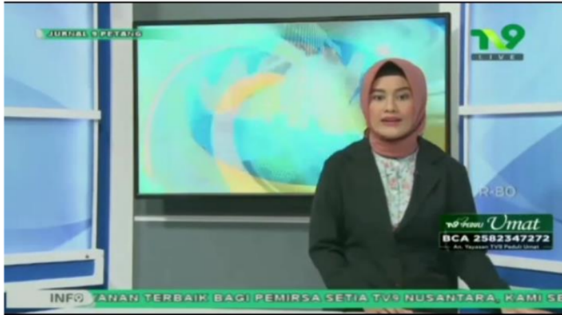
Gambar 8. Pemberitaan Ajakan Kampanye Memperingati Hari Pendengaran Sedunia di TV Lokal