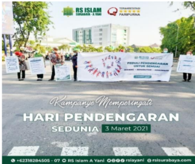
Gambar 5 Ajakan Kampanye Memperingati Hari Pendengaran Sedunia Untuk Di Media Sosial

Ajakan kampanye di media social sangat lah penting, untuk mengingatkan masyarakat untuk tetap peduli terhadap kesehatan telinga dan kebersihan telinga. Poster ini akan di posting di media social yaitu Whatsup, Instagram, Facebook