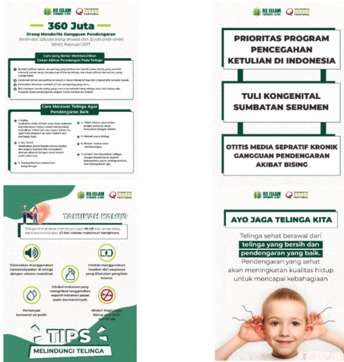
Gambar 4. Poster Kampanye Memperingati Hari Pendengaran Sedunia Untuk Aksi Turun Ke Jalan

Beberapa poster yang dibuat dimaksudkan untuk menumbuhkan kepedulian terhadap fungsi pendengaran antara lain adalah (1) poster yang menyajikan fakta 360 juta orang menderita gangguan pendengaran, (2) poster yang menunjukkan pemerintah Indonesia dalam keseriusannya mencegah ketulian yang diakibatkan kebisingan, (3) poster yang berisi bahwa beberapa fakta yang menyebabkan gangguan pendengaran diantaranya adalah penggunaan headset, (4) poster yang berisi untuk menjaga telinga supaya tetap sehat dan bersih