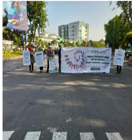
Gambar 2 Aksi Turun Kejalan dalam Rangka Kampanye Pendengaran Peduli Sesama