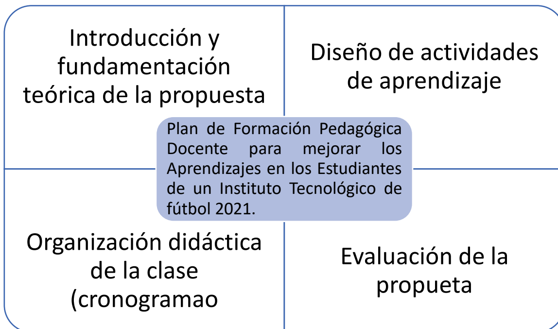
Figura 1. Síntesis gráfica de la propuesta.

Se realizará después de cada actividad a través de una matriz en la que se plasmarán los logros, dificultades y alternativas de mejora.