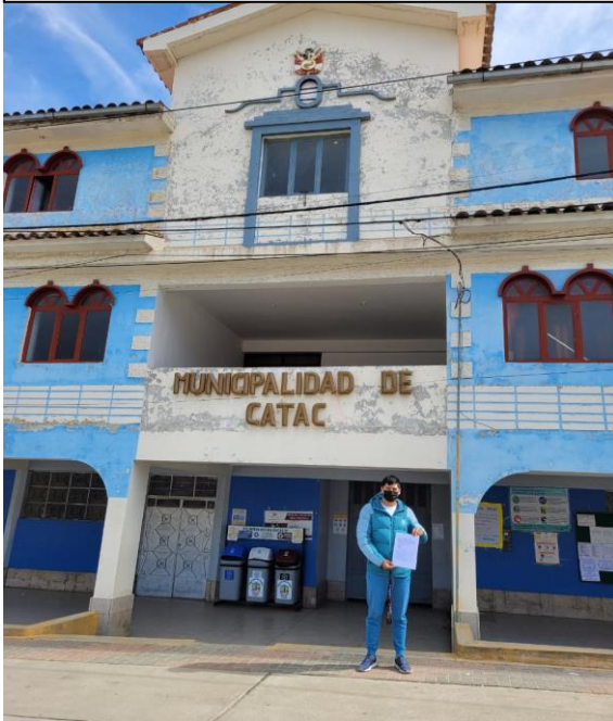
FOTOGRAFÍA 1: Municipalidad de Cátac