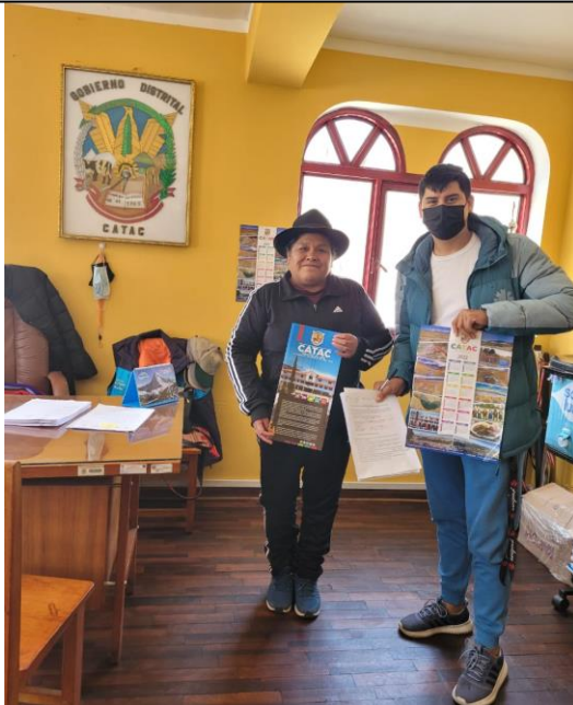
FOTOGRAFÍA 3: Alcaldesa de Cátac