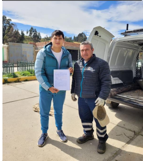
FOTOGRAFÍA 2: Prestatario de caballos en Pastoruri