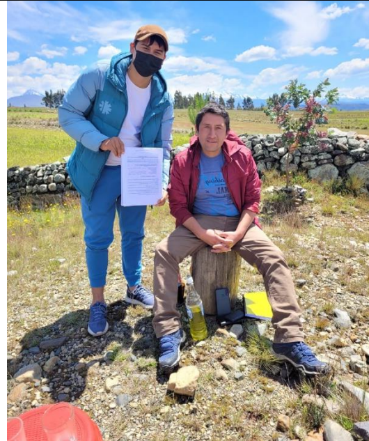
FOTOGRAFÍA 4: Emprendedor Turístico y Regidor de la Municipalidad de Cátac