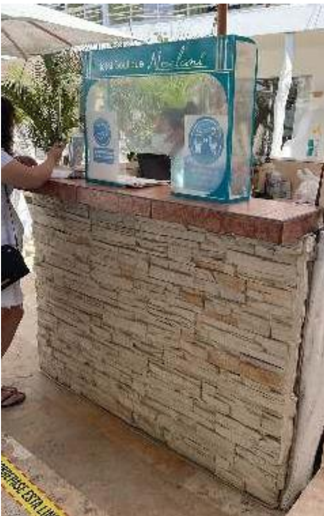
Hotel boutique "Noelani"