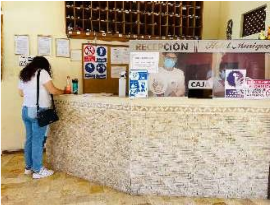
Hotel "El Murique"