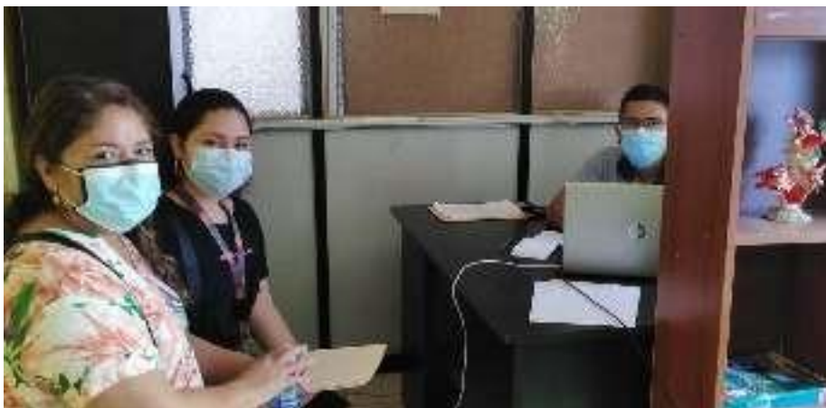
Municipalidad Provincial de Tumbes