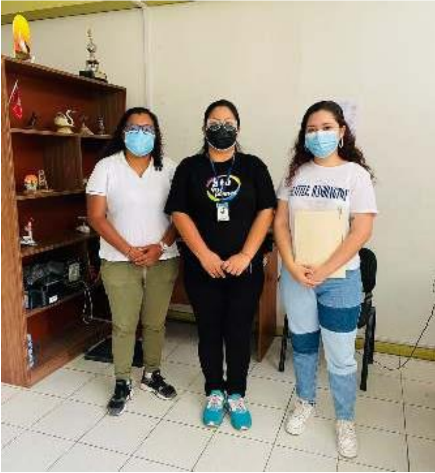
Municipalidad Distrital de Zorritos