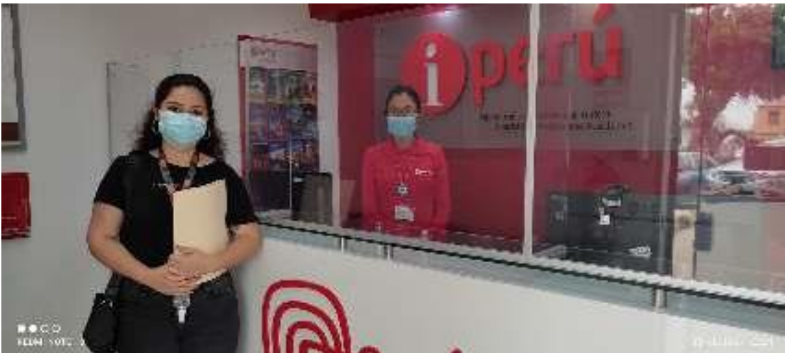
Prom Perú Tumbres