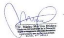
Firma del experto