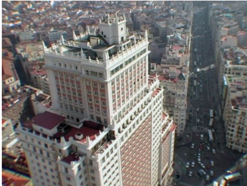
Figure 1. Opening shot. Edificio España (2012).

Naturaleza, lo monumental y las redes tecnológicas urbanas en Edificio España (2012) y La ciudad oculta (2018) de Víctor Moreno