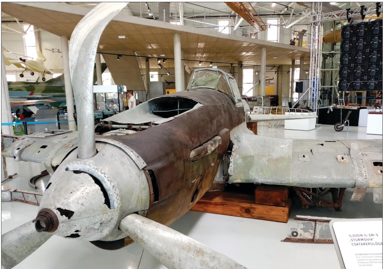
Fig. 15 IL-2 aircraft wreckage from Lake Balaton in the exhibition of the RepTár Museum of Szolnok (2021) (Ministry of Defence Military History Institute and Museum, Mechanised Military Equipment Collection)

14. kép Hüvely-fenékbelgyeg az amerikai Remington Arms („R A”) jelzésével (2021)