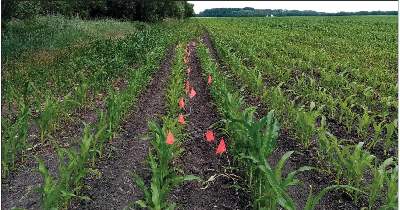
Fig. 11 Metal detector survey at the site of Bányogyszovát (2021) 11. kép Fémkereső műszeres terepbejárás a bányogyszováti lelőhelyen (2021)