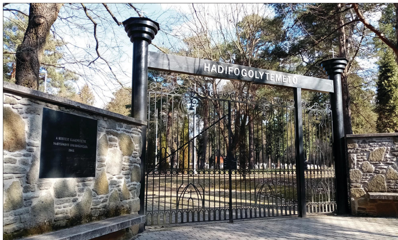
Fig. 8 The entrance of the prisoner of war cemetery of Ostffyasszonyfa (2021) 8. kép Az ostffyasszonyfai hadifogolytemető bejárata (2021)