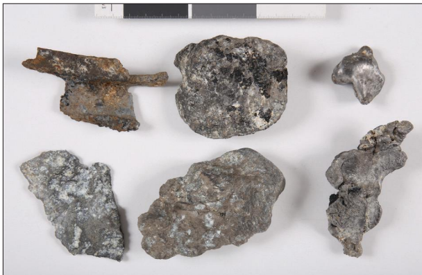
Fig. 12 Deformed and burnt aircraft wreckage fragments from Bányogyszovát (2021)

12. kép Deformálódott és megégett repülőgép-roncsdarabok Bányogyszovátról (2021)