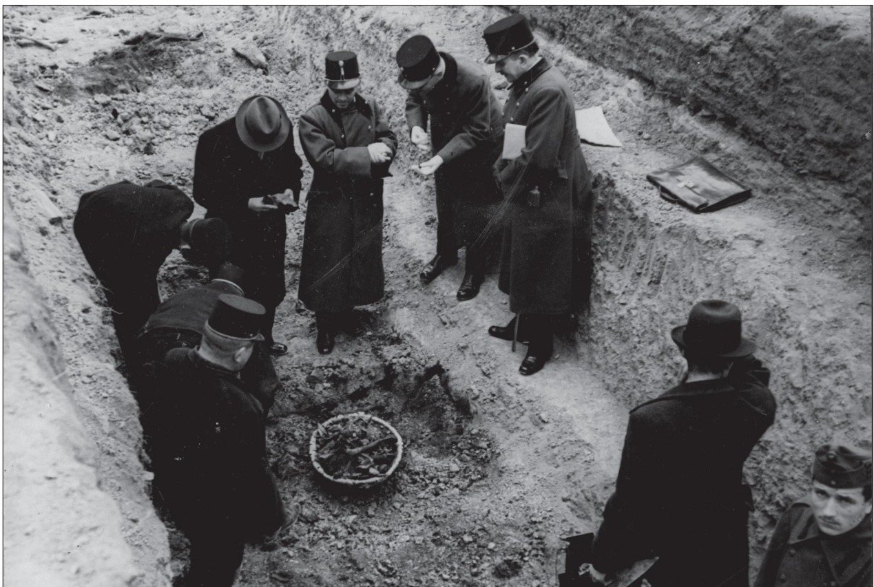
Fig 1 The excavation of the Honvéd war grave of Tabán in 1939

In legal terms, in Hungary, we cannot speak of archaeological finds, archaeological objects or archaeological sites in the case of dating beyond the AD 1711 era (Act LXIV of 2001 on the Protection of Cultural Heritage, 37. §, internet resource: https://