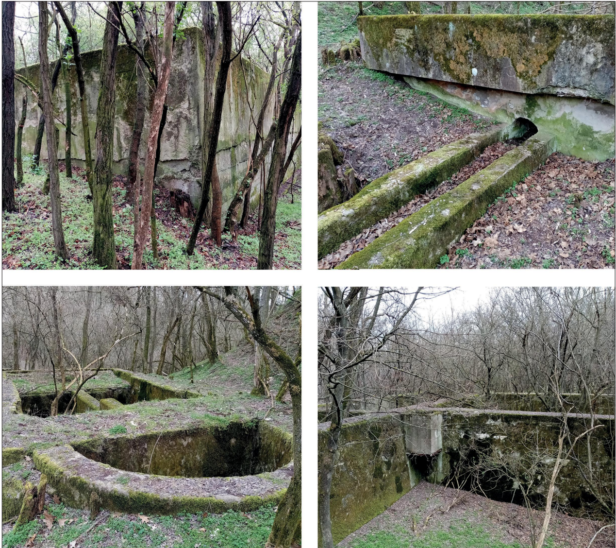
Fig. 10 The remains of the sedimentation system of the POW camp of Ostffyasszonyfa (2021) 10. kép Az ostffyasszonyfai hadifogolytábor ülepítőrendszerének maradványai (2021)

wreckage and finds from the clothing and equipment of the operating crew, as well as written source research. However, in relation to the archaeological survival of aircraft wreckage, it is important to note that in most cases the wreckages were removed from the crash sites by the authorities or the military for reuse purposes. In other cases, again with the intention of secondary use, debris was often collected by the civilian population, although this activity was prohibited by state decree. A ministerial decree, countersigned on 12 July 1944, issued the following ban on wreckage to the civilian population: “No person shall touch any object dropped from an aircraft, or any aircraft which has made an emergency landing or crashed, or any part, fixture or fitting thereof, or any article of clothing or per-