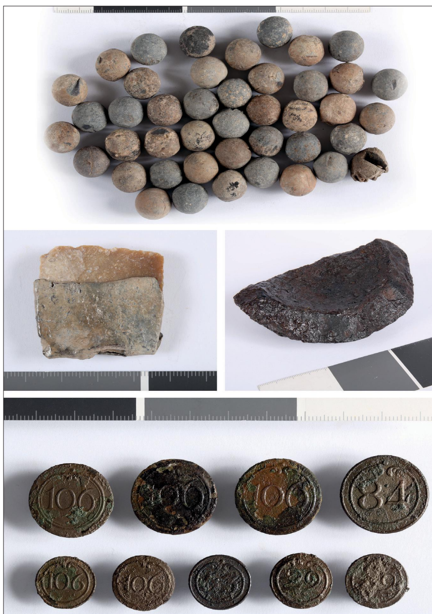
Fig. 6 Weapon and clothing artefacts (bullets, carved flint stone, fragment of grenade, uniform buttons) from the battlefield of Kismegyer (2020) (Ministry of Defence Military History Institute and Museum, Military Archaeology Collection)

6. kép Fegyver- és ruházati leletek (kézilőfegyver-lövedékek, kovakő, gránátrepesz, egyenruhagombok) a kismegyeri csatateréről (2020) (HM Hadtörténeti Intézet és Múzeum, Hadirégészeti Gyűjtemény)