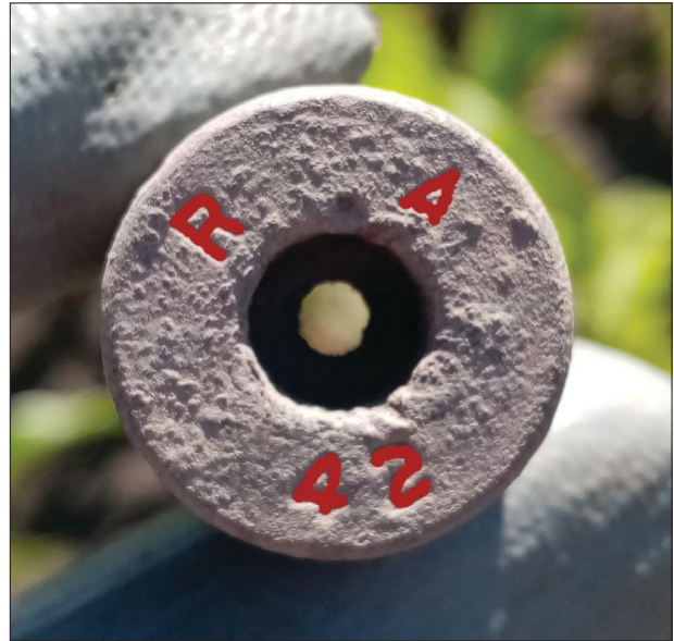
Fig. 14 Thumb stamp with the American Remington Arms (“R A”) mark (2021)

Today, conflict archaeology is an innovative and complex field of research involving several disciplines, for which the Military History Institute and Museum is trying to provide a professional forum also in Hungary. The museum’s yearbook, the