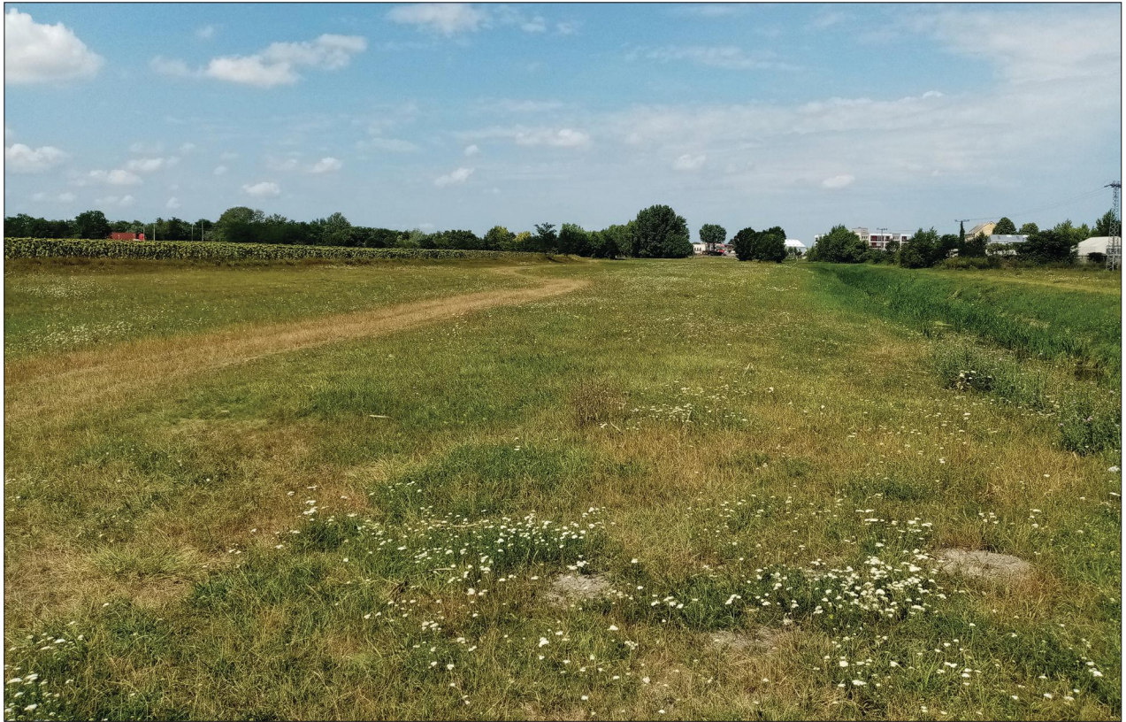
Fig. 5 Detail of the area of the metal detector survey at Kismegyer (2020) 5. kép A kismegyeri fémkereső műszeres terepbejárás helyszínének részlete (2020)

fieldwork which lasted two days in October 2019, 26 metal artefacts were recovered, 12 of which were related to the battle of 1809. One fragmentary button, three grenade shrapnel, one deformed (fired/impacted) and seven intact (dropped/laid) small arms projectiles were uncovered. The intact pellets were all 16 mm in diameter. The fieldwork started north-west, south-west and east of the Battle of Kismegyer monument continued in 2020. A significant number of artefacts, including intact and deformed small arms ammunition were found along the Kismegyer section of the Győr–Pannonhalma cycle path during the archaeological survey by the Rómer Flóris Art and History Museum. Further field surveys covered an area of about 49,000 m 2 of land along the Pándzsa creek in 2020 (Fig. 5). The new work has uncovered further 170 artefacts relating to the 1809 battle, arranged by type of artefact in Table 1 (Fig. 6).