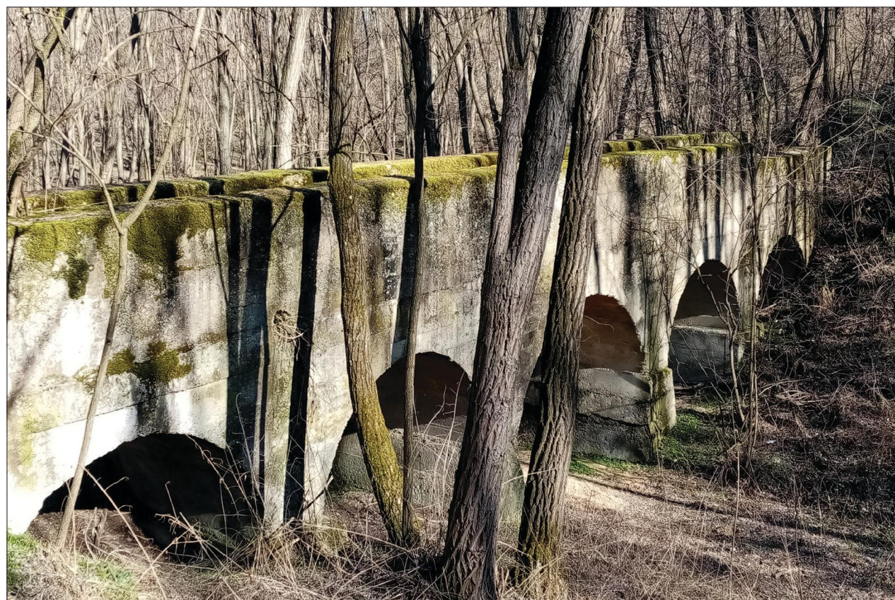
Fig. 9 One of the utility bridges to the POW camp of Ostffyasszonyfa (2021) 9. kép Az ostffyasszonyfai hadifogolytábor egyik közműhídja (2021)