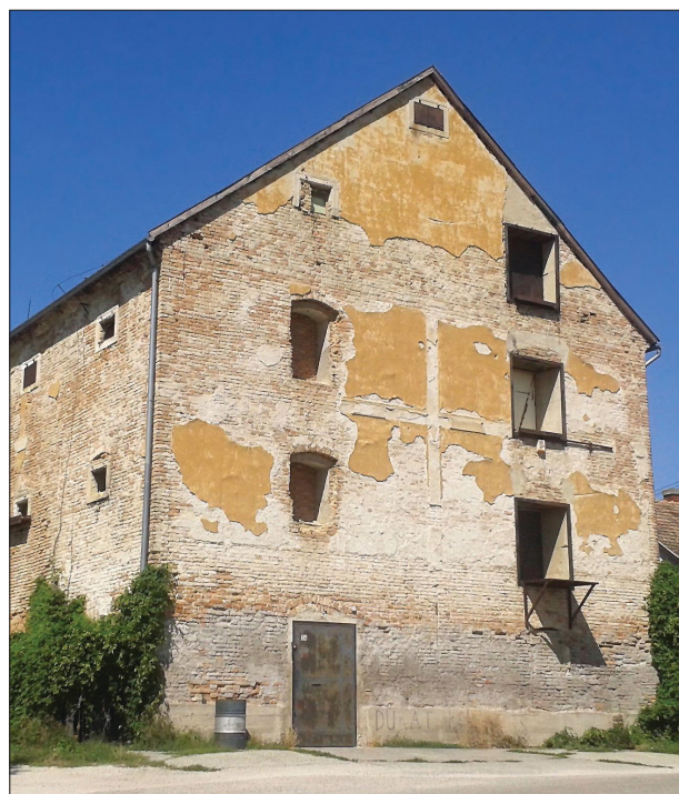
Fig. 4 The building of the Benedictine priory's granary of Kismegyer (2019) 4. kép A kismegyeri bencés apátsági magtár épülete (2019)