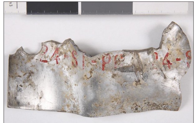
Fig. 13 Wrecked piece with painted mark (2021) (Ministry of Defence Military History Institute and Museum, Military Archaeology Collection, photo: Péter Szikits)

12. kép Deformálódott és megégett repülőgép-roncsdarabok Bányogyszovátról (2021) (HM Hadtörténeti Intézet és Múzeum, Hadirégészeti Gyűjtemény, fénykép: Szikits Péter)