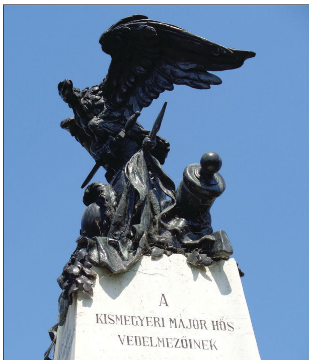
Fig. 3 The part of the monument of the battle at Kismegyer of 1809 in the Kismegyer district of Győr (2019) 3. kép Az 1809. évi kismegyeri csata emlékművének részlete Győr kismegyeri városrészében (2019)

In 2019, the Military History Institute and Museum began an investigation of the sole Napoleonic battlefield in Hungary, the site of the 1809 battle of Kismegyer. A probationary metal detector survey of the battlefield was executed in October 2019 with the help of volunteers on a 14,500 m 2 plot of land in the area of the monument erected in 1897. During the