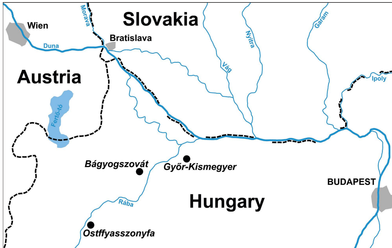
Fig. 2 Sketch-map to the research areas (Győr-Kisbajcs, Ostffyasszonyfa, Bányavásáros) (drawn by Kristóf Csákvári, Ministry of Defence Military History Institute and Museum)

2. kép Térképábrázolás a kutatási területekhez (Győr-Kisbajcs, Ostffyasszonyfa, Bányavásáros) (rajzolta: Csákvári Kristóf, HM Hadtörténelmi Intézet és Múzeum)