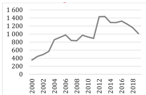
3. ábra Évente otthonteremtési támogatásban részesült fiatal felnőtt (2000–2019)

Továbbra is a KSH intézményi adatgyűjtésére támaszkodva, azt mondhatjuk, hogy 2000 és 2010 között igencsak kevesen jutottak egyáltalán ilyen támogatáshoz, amikor nagykorúvá válva kiléptek az állami gondozás keretei közül. Ezt követően megváltoztak a hozzájutás szabályai is, a statisztikai számbavétel is, mely szerint 2010 után először többen, majd évről évre egyre kevesebben jutnak hozzá ehhez a szerény segítséghez (3. ábra)