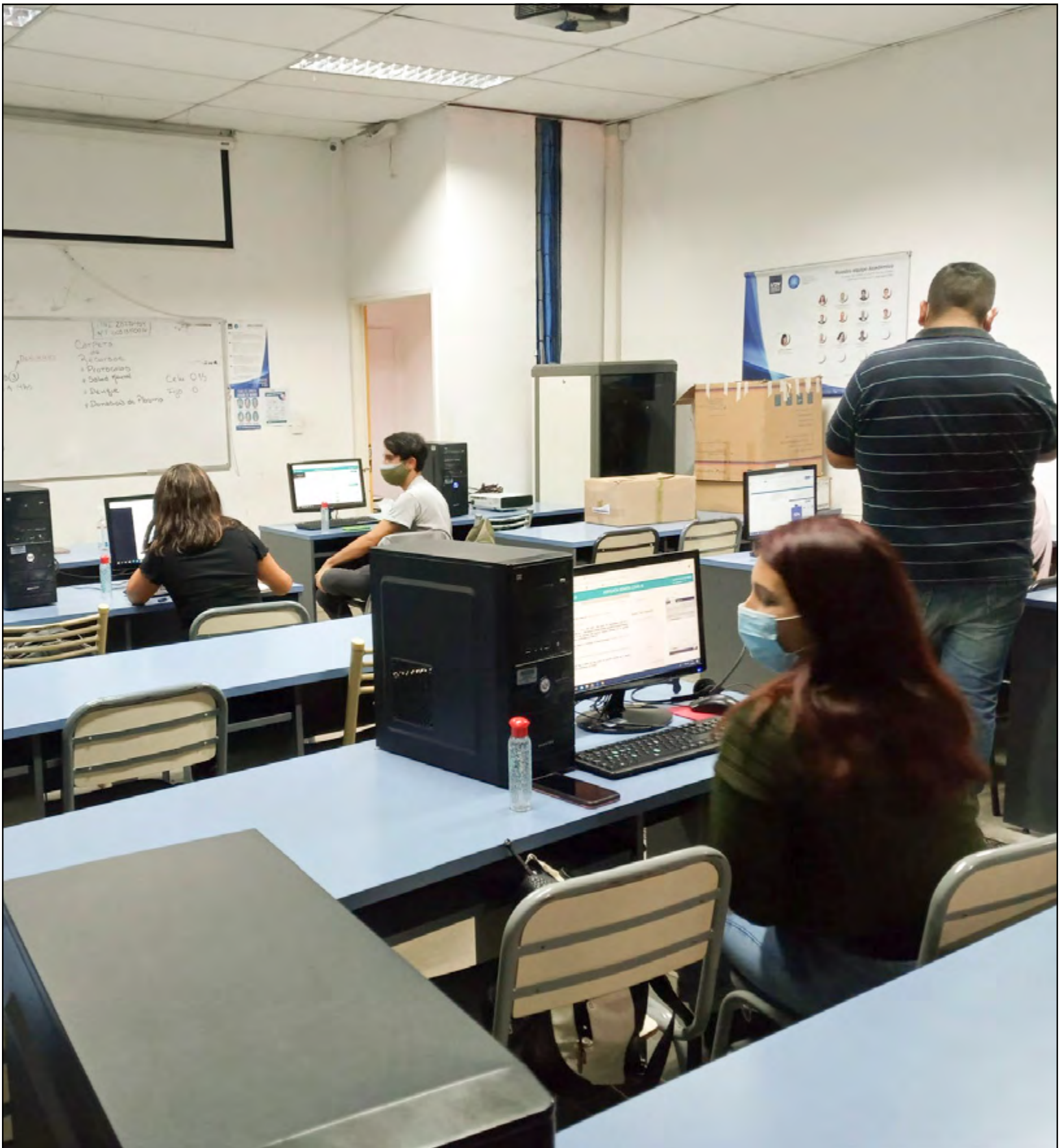
GENTILEZA UNDAV/ICEEC Y POSA DE VACUNACIÓN