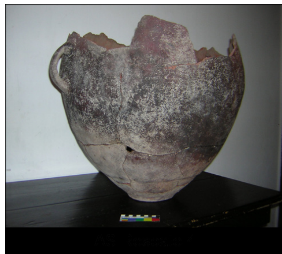
Figura 5. Remontaje de Virque, rescate cuatro, AAS. Olla grande con dos asas, de base plana, con engobe rojizo/violáceo. Muy impregnada de ollín en base y sector inferior del cuerpo. Posible función: Almacenamiento/Procesamiento.

Figure 5. Refitting of Virque, rescue four, AAS. Big pot with two handles and plain basis, with red/violet slip. With many soot spots in the basis and lower part of the body. Possible function: Storage/Processing.