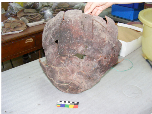
Figura 4. Remontaje de gran olla de rescate uno, AAS, con base plana y un asa oblicua. Decorada con un línea blanca desleída paralela al borde interno, con manchas de ollín. Posible función: Procesamiento.

Figure 4. Refitting of big vessel of rescue one, AAS, with plain basis. Decorated with a white faint line parallel to the internal edge, with soot spots. Possible function: Processing.