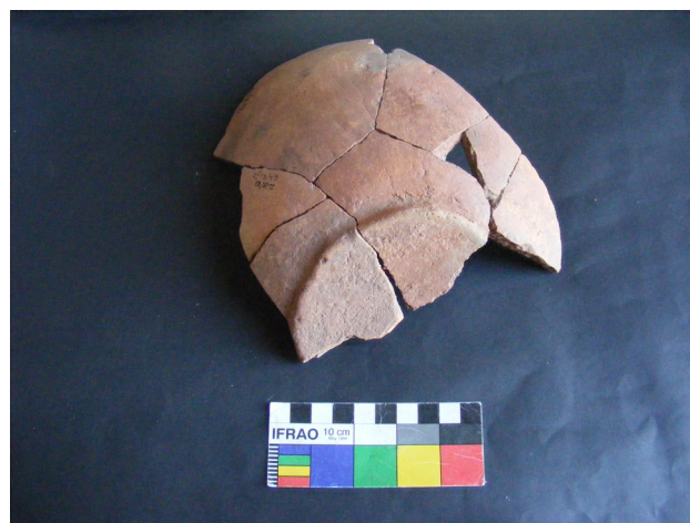
Figura 3. Remontaje de vasija cerámica de ICc5. Olla mediana globular de base plana, engobada, sin decoración. Posible función: cocción/procesamiento. Remontada con 7 fragmentos provenientes de las excavaciones 1983, 1987 y 1991.