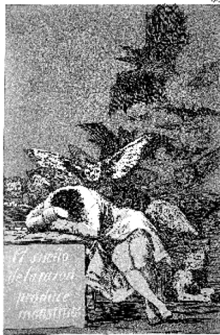
Abb. 2: Francisco de Goya: El sueño de la razón produce monstruos (Der Schlaf [Traum] der Vernunft gebiert Ungeheuer), um 1797–99, Capricho Nr. 43, Radierung, Madrid (Fotografie gemeinfrei) 32

Nach Jürgen Habermas hat gerade die erkenntnistheoretische Orientierung der neuzeitlichen Philosophie zur szientistischen Sichtweise beigetragen, dass „Wissenschaft nicht länger als eine Form möglicher Erkenntnis“ gilt, sondern es zu der Identifikation von „Erkenntnis mit Wissenschaft“ 33 kommt. Nur den als naturwissenschaftlich-objektiv verstandenen primären Qualitäten der Gegenstände im Sinne Galileo Galileis kommt objektive Realität zu, alle Wahrnehmungen und Empfindungen liegen als sekundäre Qualitäten allein im Subjekt. 34 Die Realität verengt sich auf das methodisch Nachweisbare, das streng genommen nur das Messbare ist. Daher das heute alle Forschung bestimmende und genau zutreffende – wiewohl fiktive – Zitat Galileis: „Wer naturwissenschaftliche Fragen ohne Hilfe der Mathematik lösen will, unternimmt Undurchführbares. Man muss messen, was messbar ist, messbar machen, was es nicht ist.“ 35 Wie Max Horkheimer in seiner grundlegenden Abhandlung über die instrumentelle