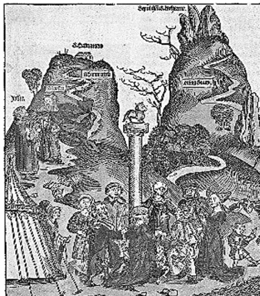
Abb. 3: Biblisches Götzenbild des Goldenen Kalbes in Hartmann Schedels Weltchronik (Nürnberg 1493) (Nachweis: gemeinfrei) 136

Absolutismus und mit einem Höhepunkt in der Französischen Revolution . „Le bonheur est une idée neuve en Europe!“ bekräftigt Saint-Just, der junge Revolutionär und Freund Robespierres, in einer Rede vor dem Konvent 1794: „Europa soll erfahren, dass ihr auf französischem Territorium weder einen Unglücklichen noch einen Unterdrücker mehr sehen wollt, dass dieses Beispiel auf der Erde Früchte trage und die Liebe zur Tugend und das Glück ausbreite! Das Glück ist ein neuer Gedanke in Europa!“ Das allgemeine Glück wird im ersten Entwurf zur französischen Verfassung von 1793 zum ersten Ziel der Gesellschaft: „Le but de la société est le bonheur commun“. Sie trat jedoch nie in Kraft, die blutige Terrorherrschaft des Comité de Salut Public , des Wohlfahrtsausschusses , kam ihr zuvor und übernahm tatkräftig die Sorge für die „öffentliche Wohlfahrt“.