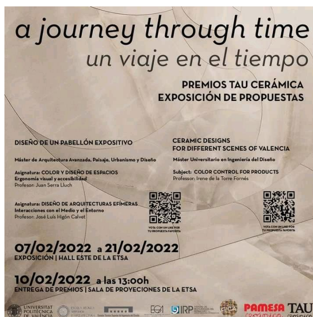
Figura 4: Cartel de la exposición “un viaje en el tiempo”

La calidad de los resultados nos anima a seguir trabajando, en colaboración con empresas y organismos públicos, para aportar los conocimientos cromáticos en la búsqueda de soluciones creativas y útiles y que supongan un aliciente en la formación del alumnado.