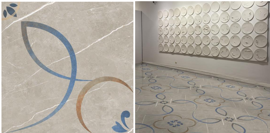
Figura 2: Diseño final de la pieza “Malagma” (izquierda) y fotomontaje (derecha).

Pueden consultarse todas las propuestas en https://colorcontrol.blogs.upv.es/category/2021-2022_a-journey-through-time/