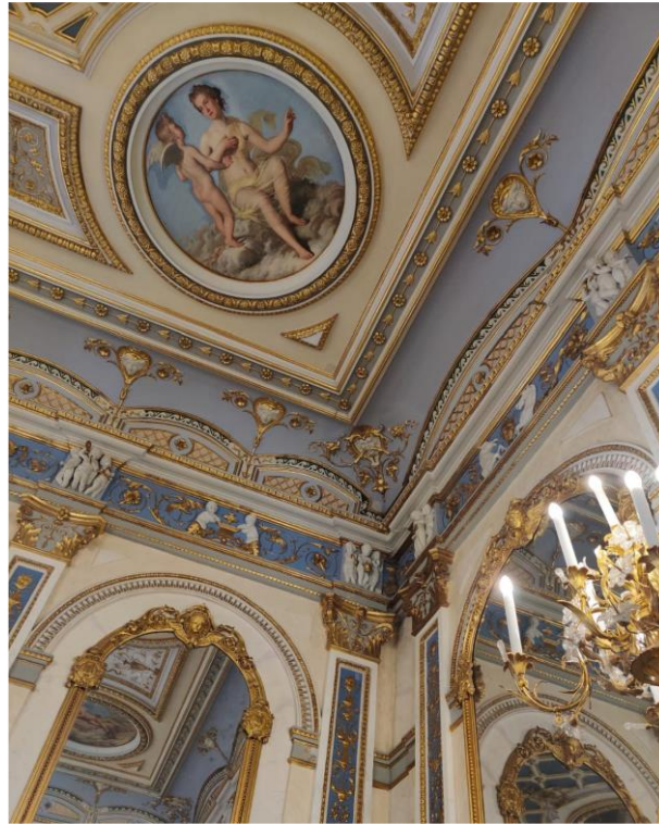
Figura 1: La referencia histórica del color en la época de la Ilustración: interior del Palacio del Marqués de Dos Aguas.

ejemplo, la propuesta “Malagma”, ideada para el Palacio del Marqués de Dos Aguas -monumento enmarcado, en líneas generales, en el período de la Ilustración- recoge los conceptos relacionados con el cromatismo de su época, sumados a los contextos físicos y funcionales (Fig. 1), para alcanzar el resultado final (Fig. 2).