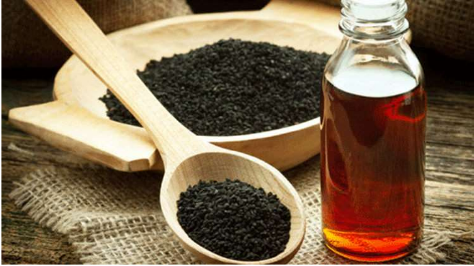
Resim 2. Çörek otu tohumu ve yağı

Çörek otu ( Nigella sativa ), birçok bitkiden farklı olarak geçmişten günümüze kadar tıbbi amaçlı olarak kullanılan bir bitkidir. Çörek otu tohumu yağının (Resim 2) Ortadoğu’da geleneksel tedavide pek çok hastalıkta (hipertansiyon, diyabet, solunum sistemi problemleri, mide-barsak problemleri, böbrek ve karaciğer hastalıkları, bağışıklık sistemi problemleri vb.) yaygın olarak kullanıldığı belirtilmiştir (Ahmad ve diğerleri, 2013; Muhammad ve diğerleri, 2017).