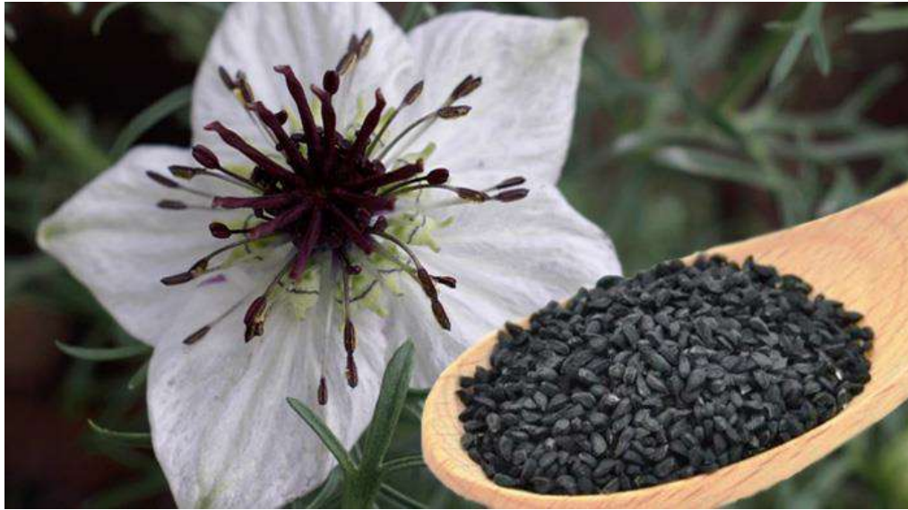
Resim 1. Çörek otu bitkisinin çiçeği ve tohumları

Çörek otu ( Nigella sativa L.) (Resim 1), Ranunculaceae (düğün çiçeğigiller) familyasına dahil olan tek yıllık, otsu bir bitkidir. Bitkinin tarımı dünyada Güney Avrupa, Suriye, Pakistan, Hindistan, Mısır, Suudi Arabistan, İran vb. ülkelerde yaygın olarak yapılmaktadır (Randhawa ve Al-Ghamdi, 2002). Ülkemizde ise Trakya, Kuzey Anadolu ve Akdeniz bölgesinde yetiştirilmektedir (Tonçer ve Kızıllı, 2004).