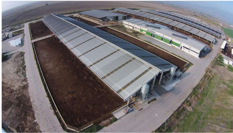
Resim 3. Özlem Süt Çiftliği

Araştırmanın materyalini 1200 sağmal kapasiteli özel bir entansif süt sığırcılığı işletmesinde (Özlem Süt Çiftliği – Özlem Tarım Ürünleri Sanayi ve Ticaret A.Ş. Süleymaniye Köyü Salihli-Manisa) (Resim 3) yedi haftalık zaman dilimi içinde (19 Kasım 2015 – 4 Ocak 2016) doğan 64 baş Siyah-Beyaz Alaca (Holstein) ırkı buzağı oluşturdu. Belirtilen süreçte aynı çevrede ve aynı bakım-besleme uygulanan sürüde 2. ve 3. doğumunu yapan ineklerden zamanında, doğuma müdahale olmadan ve sağlıklı olarak doğan 64 adet buzağı (32 erkek ve 32 dişi) seçildi (Ek 3: Özlem Süt Çiftliği'nde uygulanan doğum protokolü)