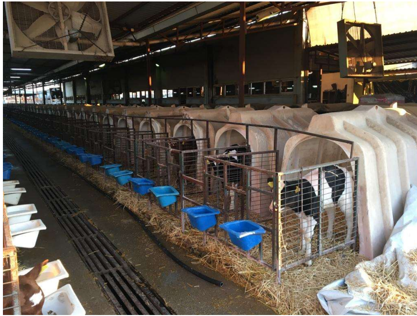
Resim 4. Çalışmada kullanılan buzağı kulübeleri

Araştırma, işletmedeki üstü kapalı yarı açık buzağı büyütme ünitesinde yürütüldü. Bireysel buzağı kulübeleri 2.4 x 1.4 m kapalı ve önünde yemlik ile suluk bulunan 1.5 x 1.2 m açık alana sahipti (Resim 6). Bireysel buzağı kulübelerinde altlık olarak saman kullanıldı ve günde bir kez yapılan temizlikte altlık yenilendi. Buzağuların her gün temizlenen suluklarında ad libitum taze su bulunduruldu. Buzağular deneme sonuna kadar bu kulübelerde barındırıldı. Deneme süresince her gün en yüksek ve en düşük hava sıcaklıkları ile bağıl nem değerleri kaydedildi. Sıcaklık-nem indeksi değerleri SNİ = Sıcaklık - (0.55 - (0.55 \times (Bağıl\ nem/100)) \times (Sıcaklık - 58)) eşitliği kullanılarak hesaplandı (Amundson ve diğerleri, 2005).