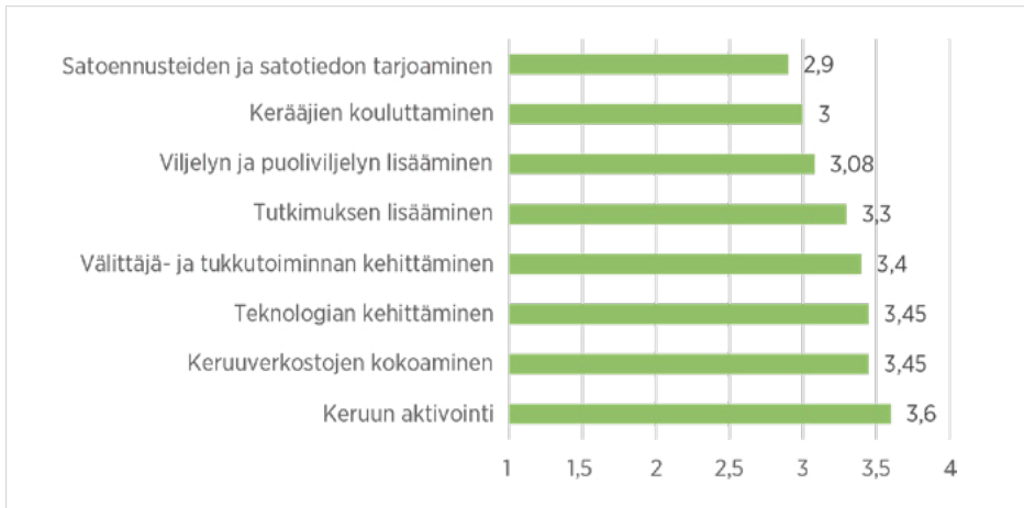
Kuvio 3. Kehittämisalueiden merkittävyys vastaajien mukaan.