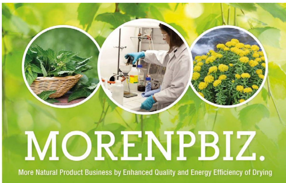
Kuva 3. MoreNPBiz-hankkeen tavoitteena oli parantaa luonnontuoteyritysten kilpailukykyä ja pääsyä kansainvälisille markkinoille kehittämällä energiatehokkaita ja tuotteiden laadun säilyttäviä kuivausmenetelmiä sekä yrityksille sopivia laaduntodentamismenetelmiä mm. kuivattavien materiaalien tehoainepitoisuuksien osoittamiseksi. Kansainvälistä hanketta toteuttivat Suomessa Centria-ammattikorkeakoulu ja Oulun ammattikorkeakoulu.

Luonnontuotteiden laatuun panostettiin hankkeissa kehittämällä säilömis- ja ja- lostusmenetelmiä sellaisiksi, että laatu ja ominaisuudet säilyvät parhaalla mahdollisel- la tavalla. Raaka-aineen laadun valvomista ja jäljitettävyyttä edistettiin erityisesti uusia testausmenetelmiä luomalla. Testausmenetelmillä pyrittiin muun muassa tunnistamaan haitallisia ja hyödyllisiä aineita sekä niiden pitoisuuksia tuotteissa. Laaduntodentamis- menetelmiä luotiin etenkin hankkeissa MoreNPBiz. More Natural Product Business by Enhanced Quality and Energy Efficiency of Drying (kv-rahoitus) ja Laatusormenjälki arktiselle luonnon raaka-aineelle (Arctic FingerPrint) (EAKR).