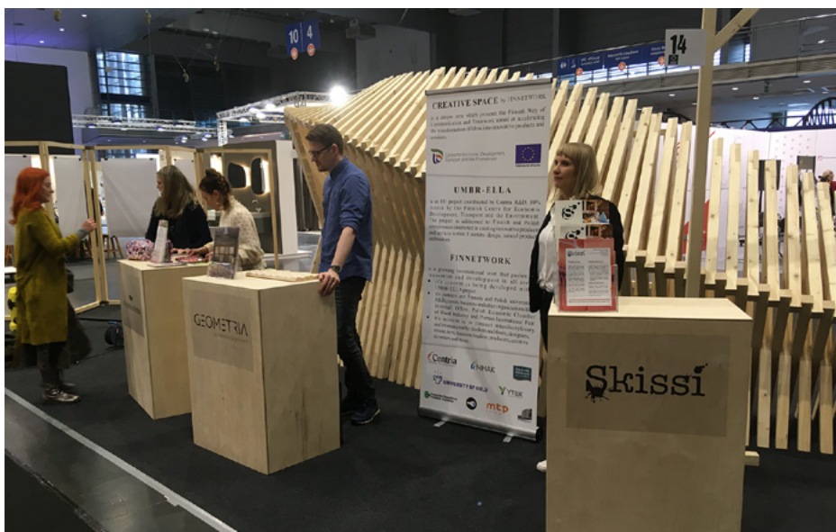
Kuva 2. UMBR-ELLA -hanke (Universal Model Boosting Resilience - Entrepreneurial Learning Lab Abroad) on kansainvälisen liiketoiminnan valmennusohjelma luonnontuotealan, luovan alan ja matkailualan yrityksille. Manner-Suomen maaseudun kehittämissuunnitelman rahoittama (80 %) hanke tarjoaa monipuolisesti apua kansainvälistymiseen kuten messumatkoja ja verkostoitumista ulkomailla. Kuvassa hankkeeseen osallistuvia esittelemässä toimintaansa yhteisosastolla.

Luonnontuotealan tutkimusta toteutettiin hankkeissa erilaisista näkökulmista. Esimerkiksi hankkeessa Arvoaineita pohjoisen männystä ja marjoista (EAKR) tutkittiin saha- ja marjanjalostusteollisuuden sivuvirtojen hyödyntämistä sekä sivuvirtojen arvoaineiden terveysvaikutuksia. Hankkeessa Mikroaaltojen ja kryokonsentraation hyödynnettävyyttä teollisissa prosesseissa (KryoMikro) (EAKR) puolestaan tutkittiin muun muassa kryokonsentraation ja mikroaaltokäsittelyn soveltuvuutta elintarvikkeiden ja luonnontuotteiden prosessointiin. Teknologioiden ja terveysvaikutusten lisäksi tutkimusta tehtiin paljon myös alan liiketoimintamahdollisuuksiin sekä metsä- ja suoluonnon monipuoliseen hyödynnettävyyteen liittyen.