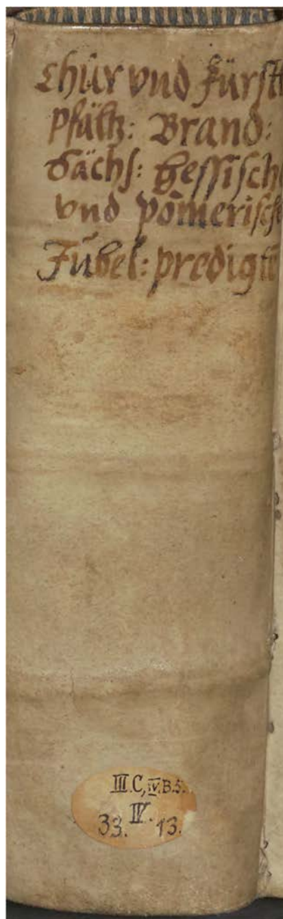
Sign. 1007293–308: Chur- vnd Fürstlich-Pfältzische, Brandenburgische, Sächsische, Hessische vnd Pommerische Jubel-Predigten [1617–1618].

populären Form der Literatur, niekiedy łączoną z ilustracjami przedstawiającymi stroje, rekwizyty lub scenografię. Wydrukowane adnotacje wyjaśniają kwestie niezrozumiałe dla osób postronnych. W XVI, a zwłaszcza w XVII w., powstają też, niezależnie od poszczególnych uroczystości, książki o tańcach, fajerwerkach i regulaminach celebracji.