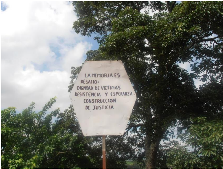
Anexo 6. Comunidad y el parque monumento a la memoria. Velásquez (2016)