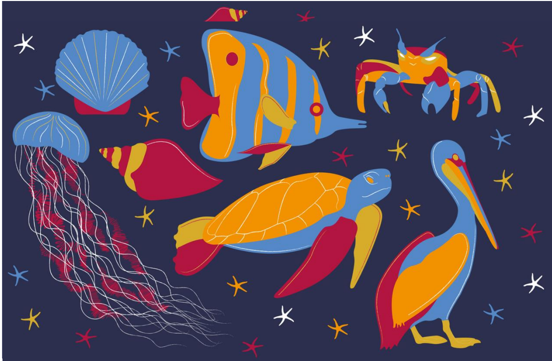
Imagen Festival Arribazón 2019: